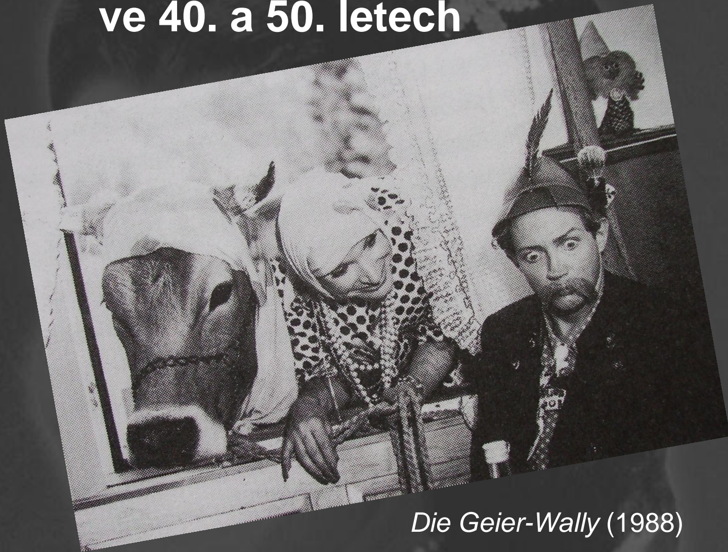
Die Geier-Wally (1988)