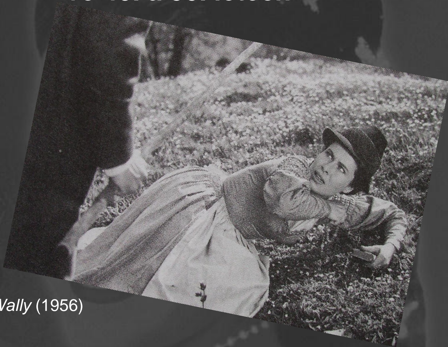
Die Geier-Wally (1956)