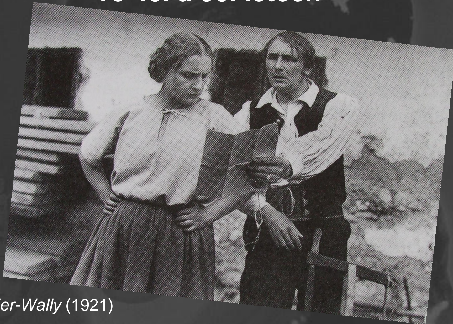
Die Geier-Wally (1921)