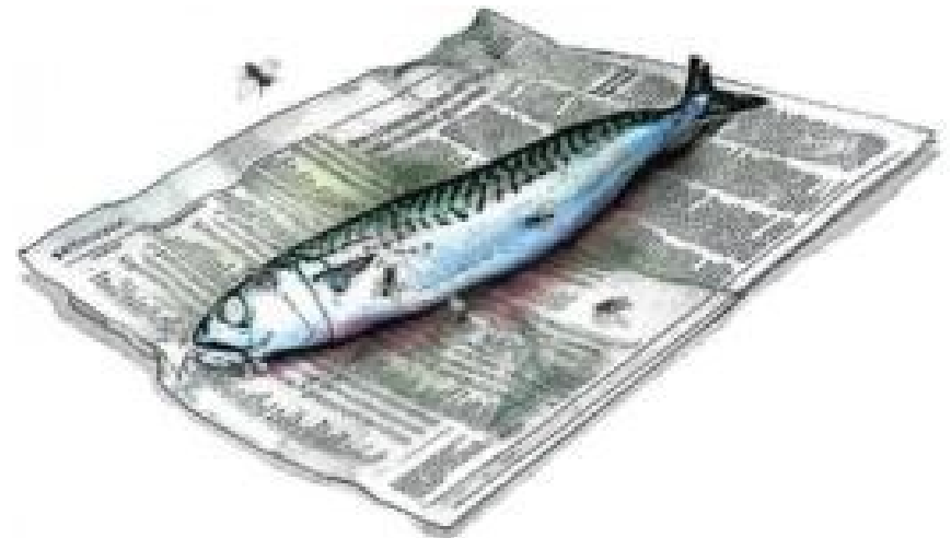
Something is smelly in the State of Media