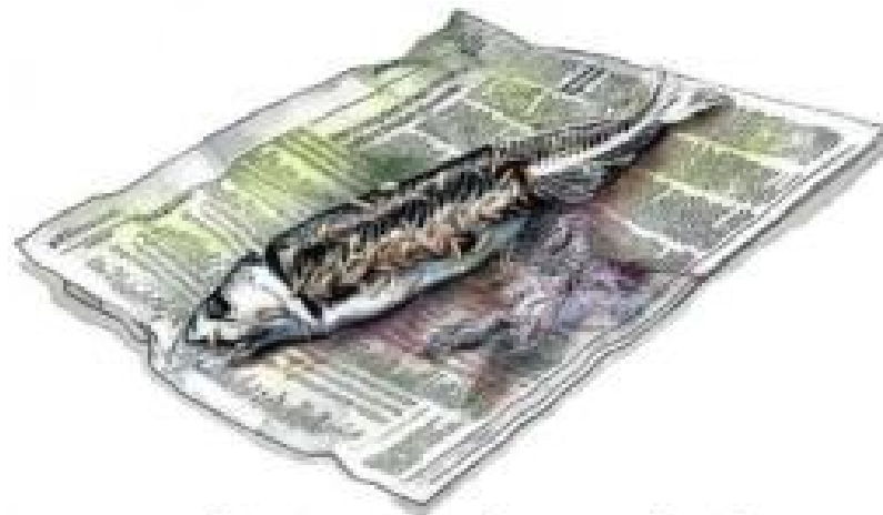
Something is rotten in the State of Media