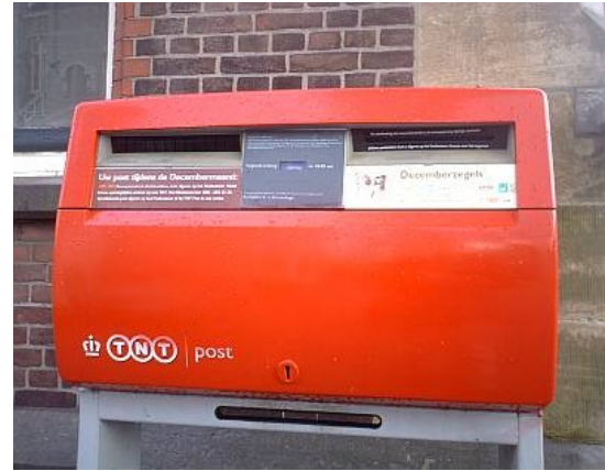
de brievenbus (een brief, twee brieven)