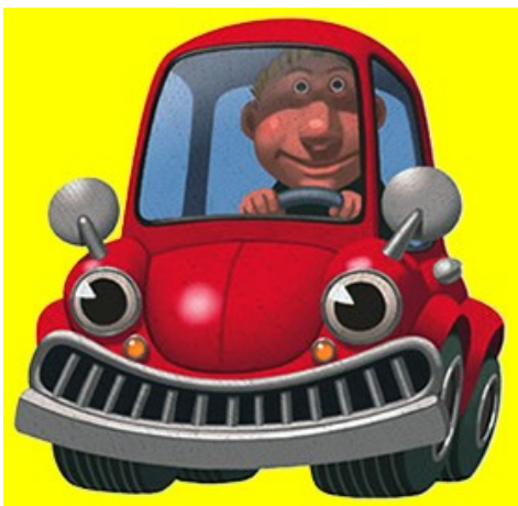
de auto met de chauffeur