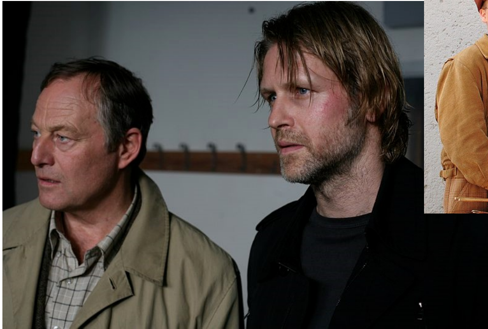
Varg Veum, 6 detektivních filmů, r. různí režiséři