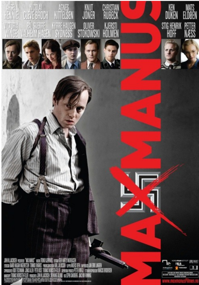
Max Manus (2008, r. Joachim Rønning, Espen Sandberg)