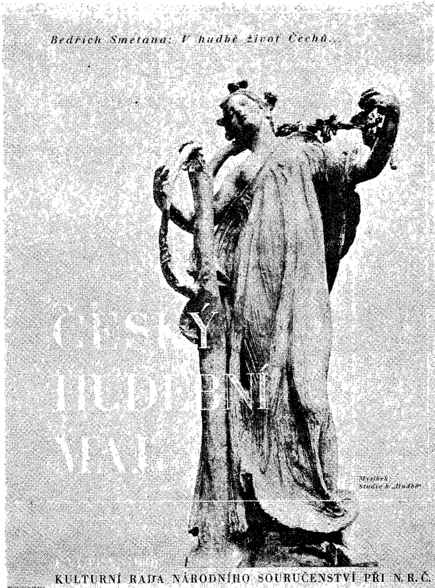
Plakát k akci Kulturní rady „Český hudební máj“ podle návrhu Jos. Muziky.

dební mistři, proniklo do všech našich krajů, do nejmenších vesnic a samot jako poselství národní duše a nesmrtelné krásy, která se z národní duše zrodila. To všechno, co uslyšíme dnes a budeme slyšet celý květen, je naše! To jsme vytvořili my! V té kráse žijeme a vždy budeme žít, my, celý národ a každý jednotlivec.