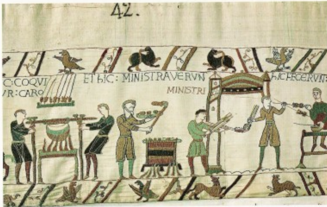
Scène 42 : Cuisiniers et boulangers normands préparent le repas servi aux chevaliers.

Koberec z Bayeux (tapiserie) nebo také koberec královny Matyldy, 11. století