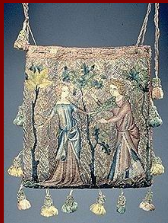
Vyšíváný váček, Francie 1340.