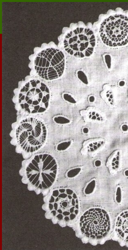
VMP - 45429