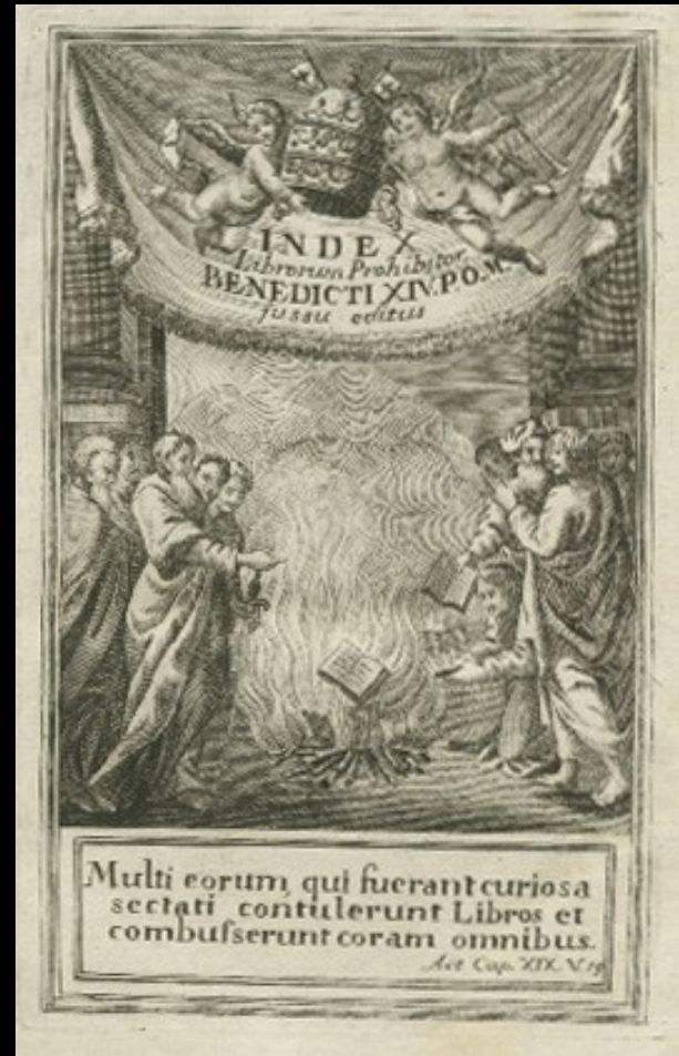
Index Librorum Prohibitorum (prvně vydán v Holandsku 1529)