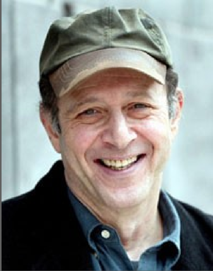
Steve Reich (*1936)