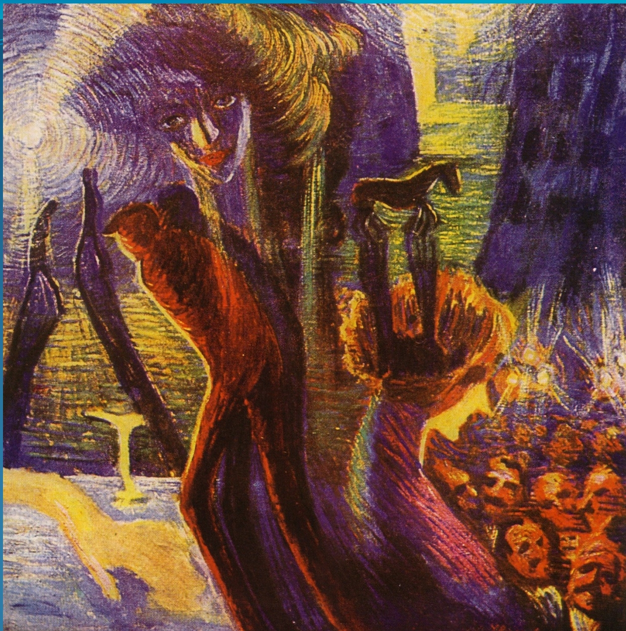
L. Russolo – Vzpomínka na jednu noc (1911)