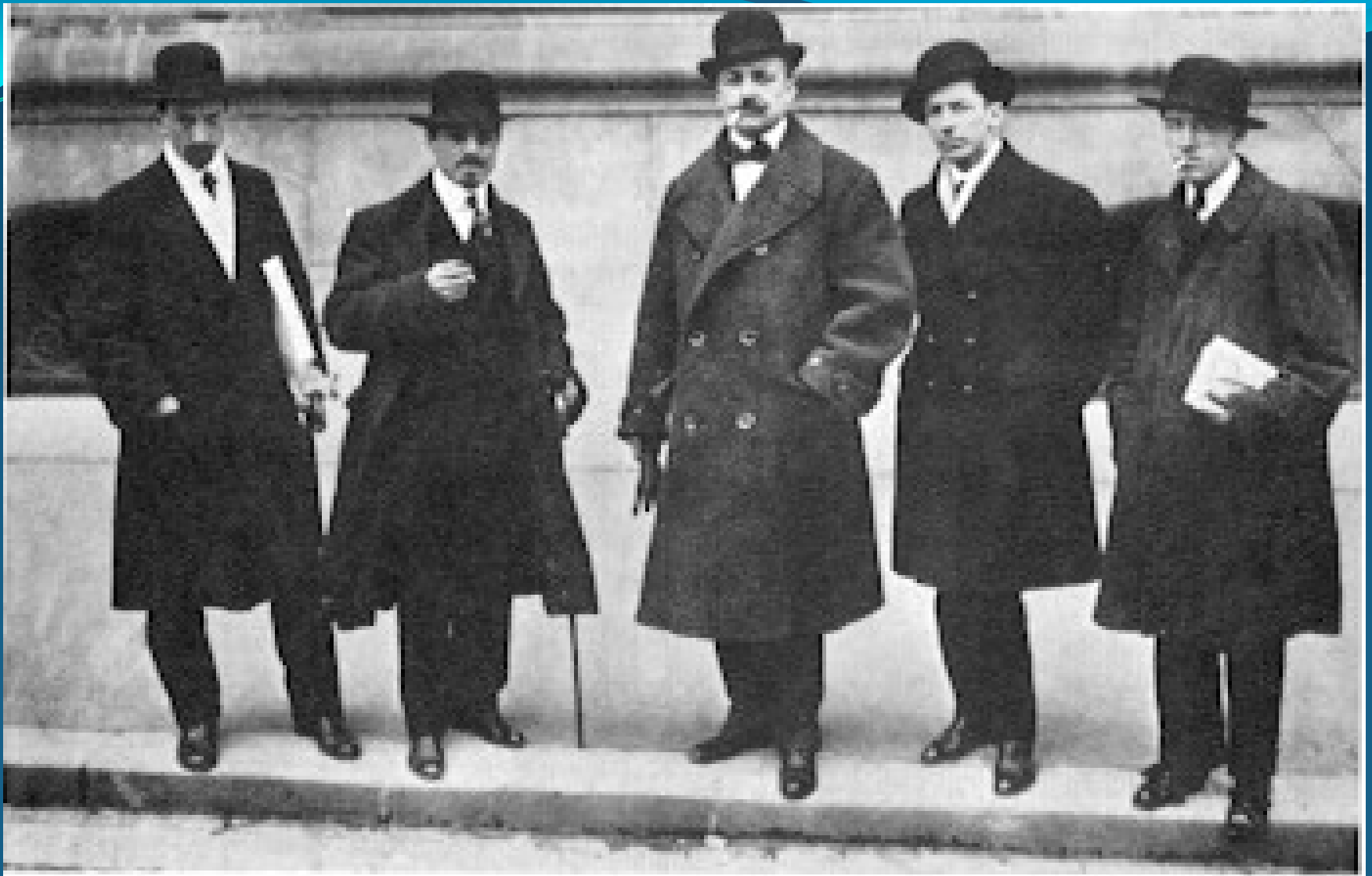
Luigi Russolo, Carlo Carrà, F. T. Marinetti, Umberto Boccioni, Gino Severini (Paříž, 1912)