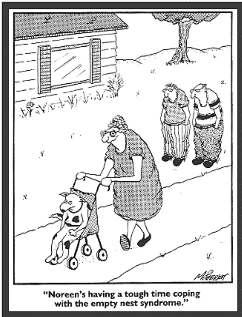
"Noreen's having a tough time coping with the empty nest syndrome."