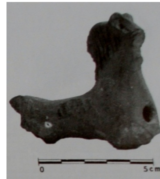
hrnčířské plastiky s koníčkem a otvorem na tyč