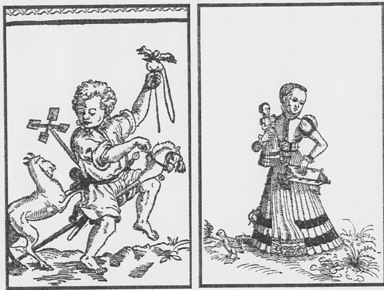
chlapecké a dívčí hračky