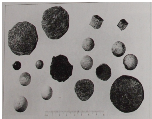
soubor hracích kamenů a kostek