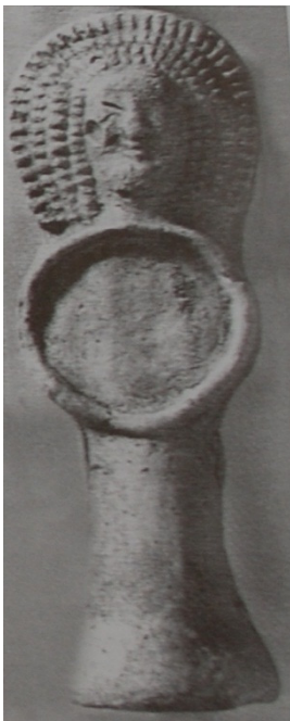
panenka s kruhovou náručí na tzv. kmotrovský peníz