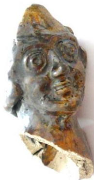
Opava, Horní Náměstí - Popská. Fragment drobné ker. plastiky. (internet)