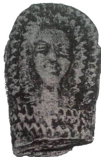
0 3 cm ZSO Stará Ves, zlomek plastiky. (Fojtík 2010, upraveno)

Nálezy: Šternberk u Telče, Jevíčko, Cheb, Helfenburk, Sezimovo Ústí, Stará Ves (ZSV), Rýmařov (hrad)