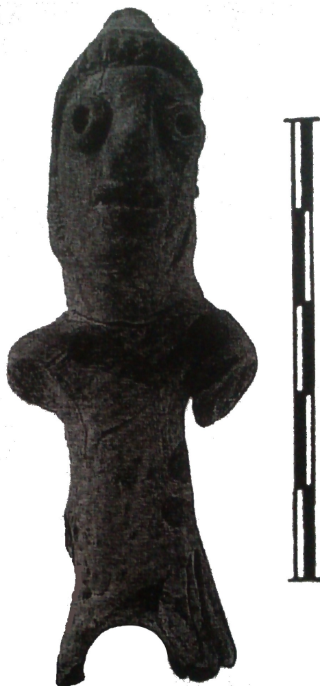
Smilův hrad. Neglazovaná plastika jezdce se stopami červeného barviva. (Měchurová 2009, upraveno)

Pozn.: omlouvám se za kvalitu obrázků, foceno mobilem.