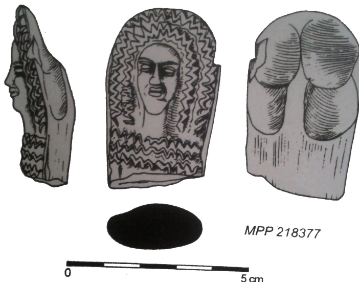
ZSO Stará Ves. Drobná keramická plastika zpodobňující ženskou figurku v dobovém čepci a rouchu. (Fojtík 2010, upraveno)