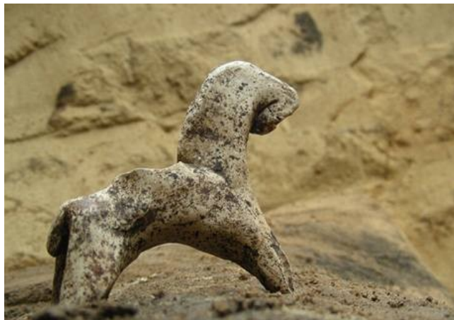
Mikulčice, drobná keramická plastika koníka. (internet)