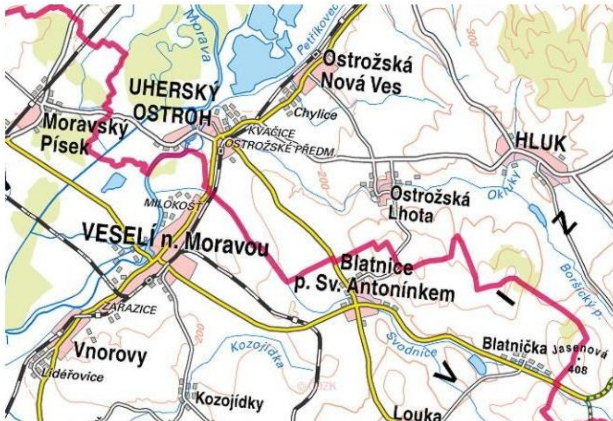
Mapa zájmových mikroregionů Veselsko a Ostrožsko.

http://cs.wikipedia.org/wiki/Blatnick%C3%A1_hora