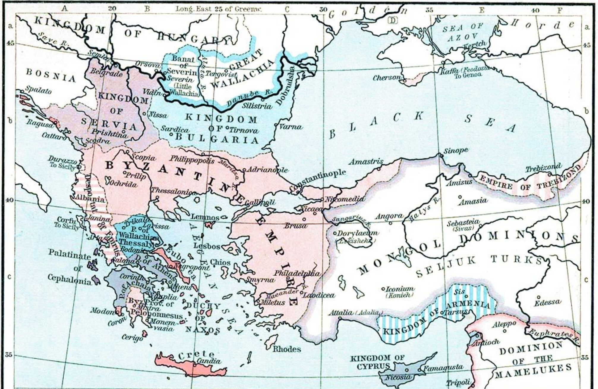
I The Byzantine Empire in 1265.