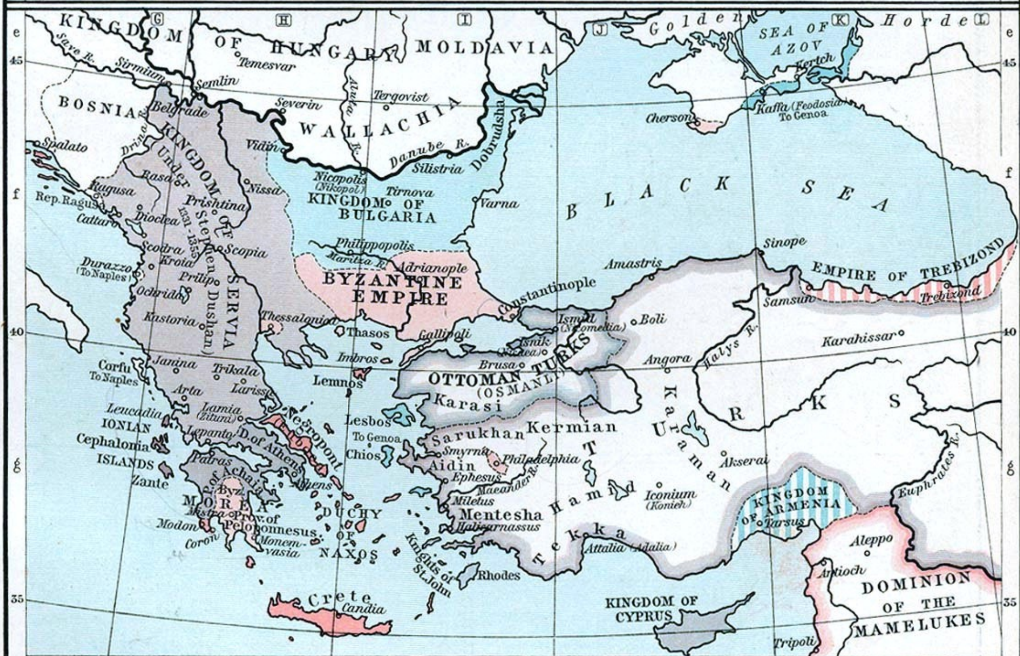
II The Byzantine Empire and the Ottoman Turks in 1355.