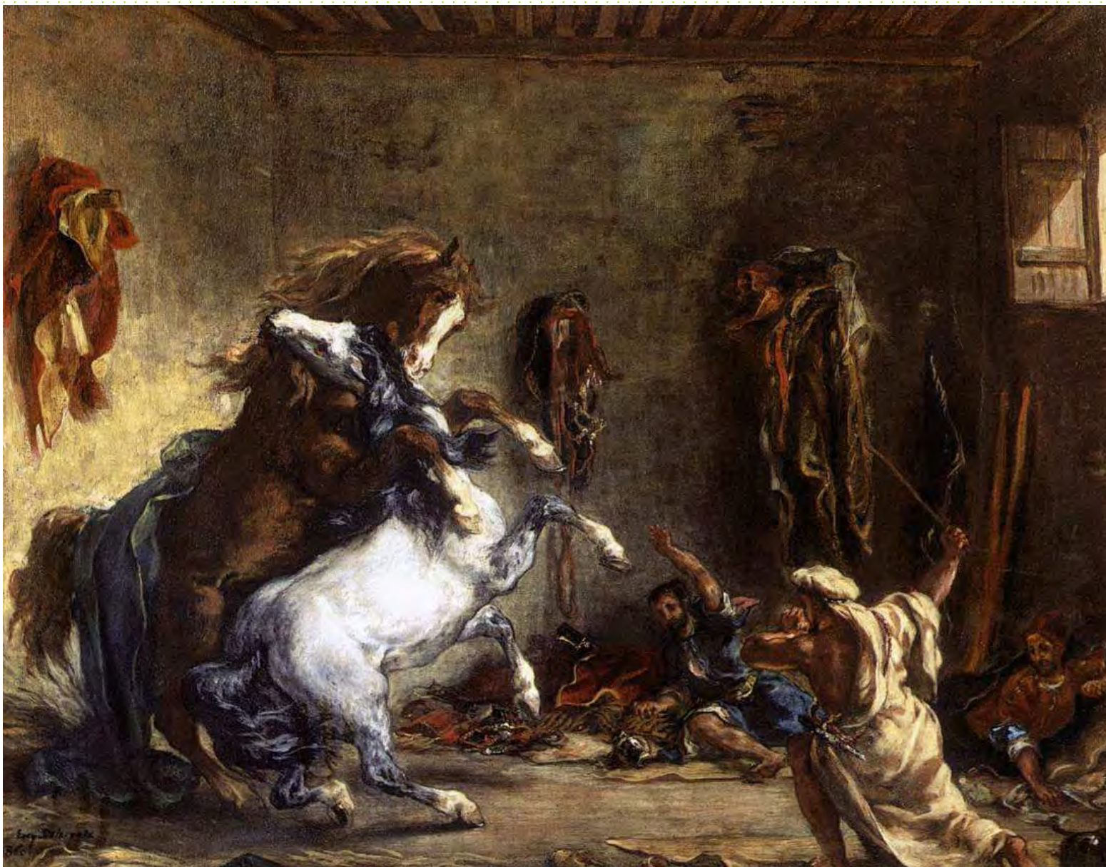
Eugène Delacroix (1798-1863), Arabští koně, bojující ve stáji, 1860, olej, plátno, 64,6 x 81 cm, Louvre, Paříž