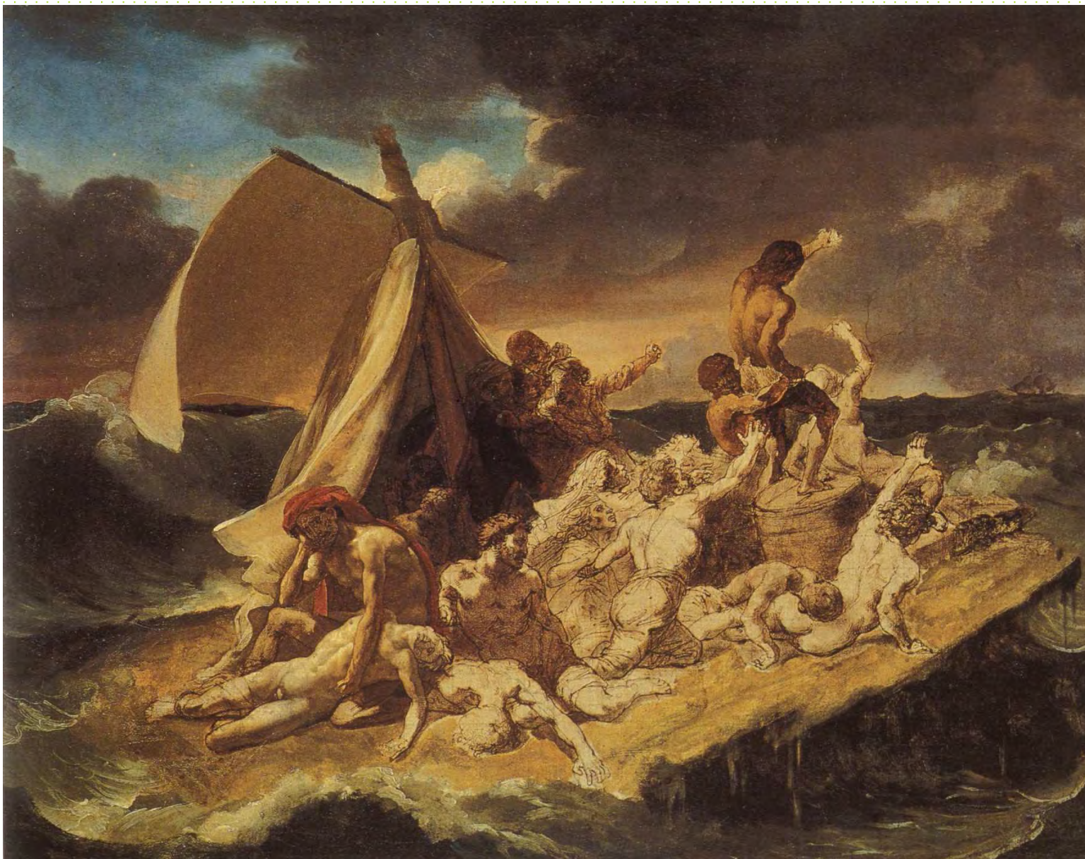
Théodor Géricault (1791-1824), Prám Medúzy - studie, olej, plátno, 37,5 x 46 cm, Louvre, Paříž