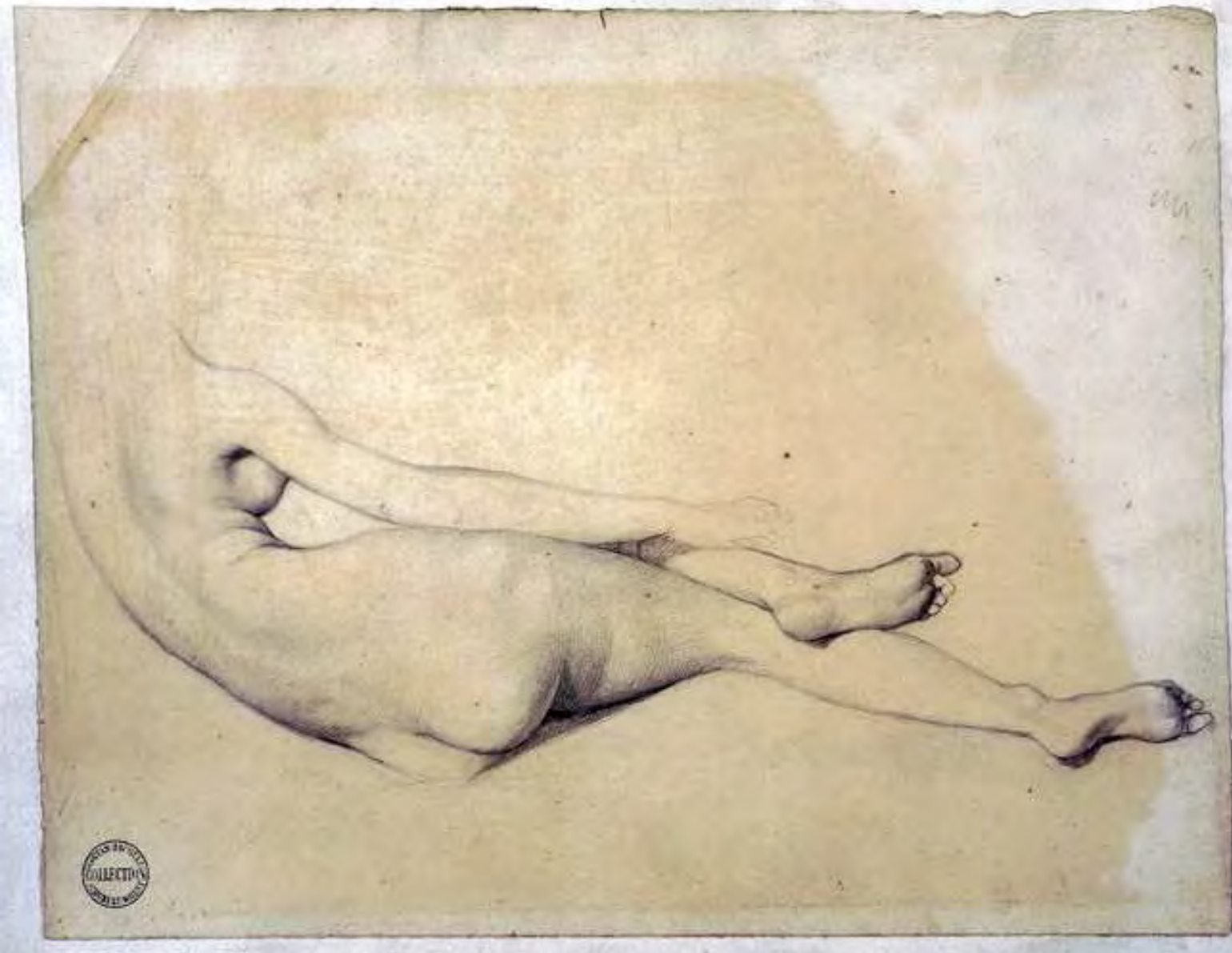
Jean August Dominique Ingres (1780-1867), `La Grande Odalisque - studie, asi 1813-1814, tužka, papír, 18,5 x 25,4 cm, Courtauld Institute, Londýn