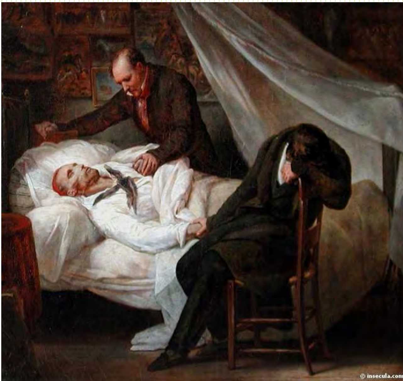
Ary Scheffer (1795-1858), Smrt Theodora Géricaulta, 1824, olej, plátno, 46 x 36 cm, Louvre, Paříž