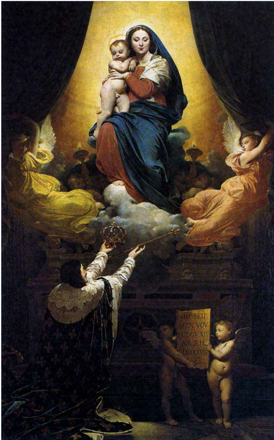
Jean August Dominique Ingres (1780-1867), Slib Ludvíka XIII., 1824, olej, plátno, 421 x 262 cm, Katedrála Notre-Dame, Montauban