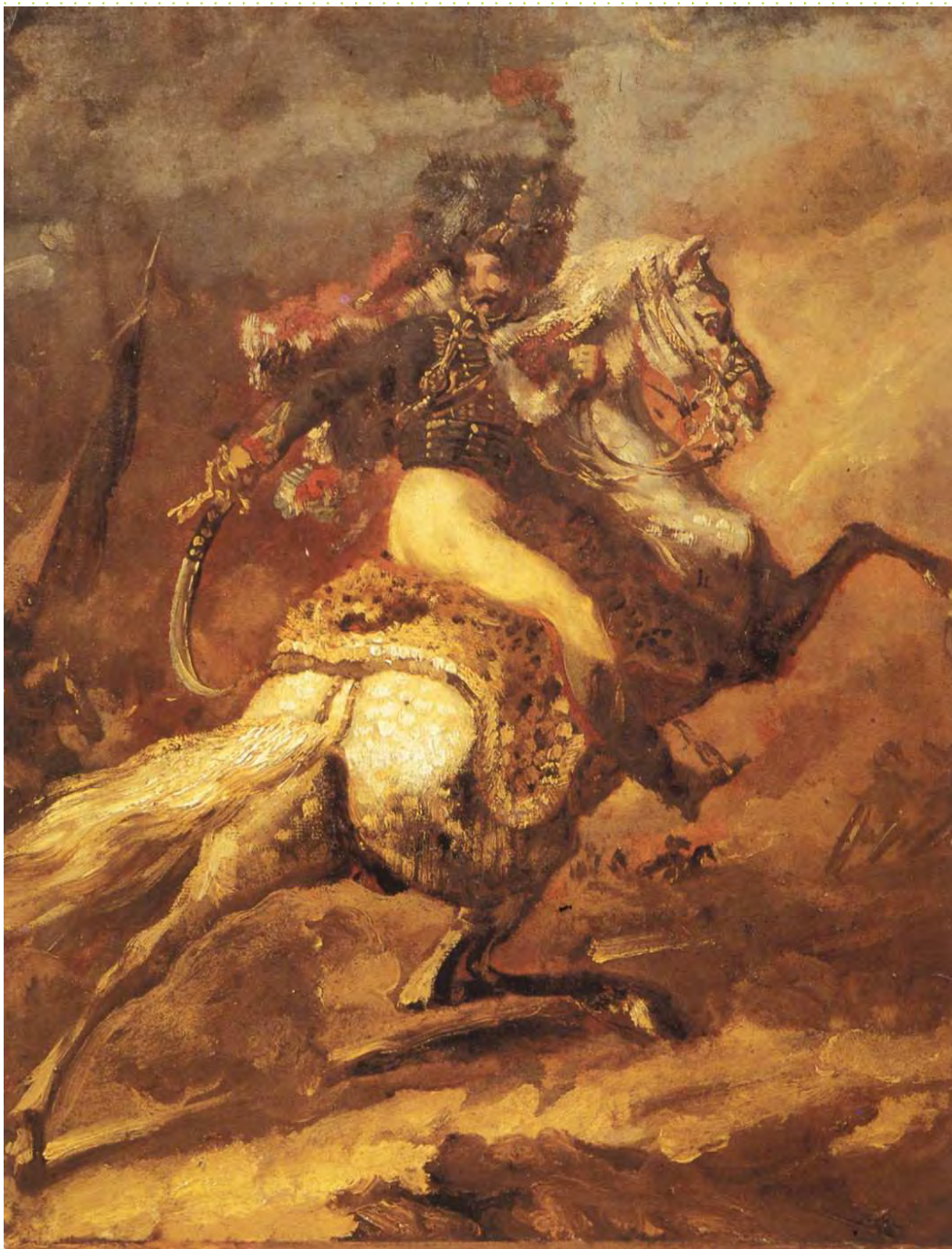
Théodor Géricault (1791-1824), Důstojník gardových myslivců při útoku - studie, 1812, olej, plátno, 52,5 x 40 cm, Musée des Beaux- Arts et de la Céramique, Rouen