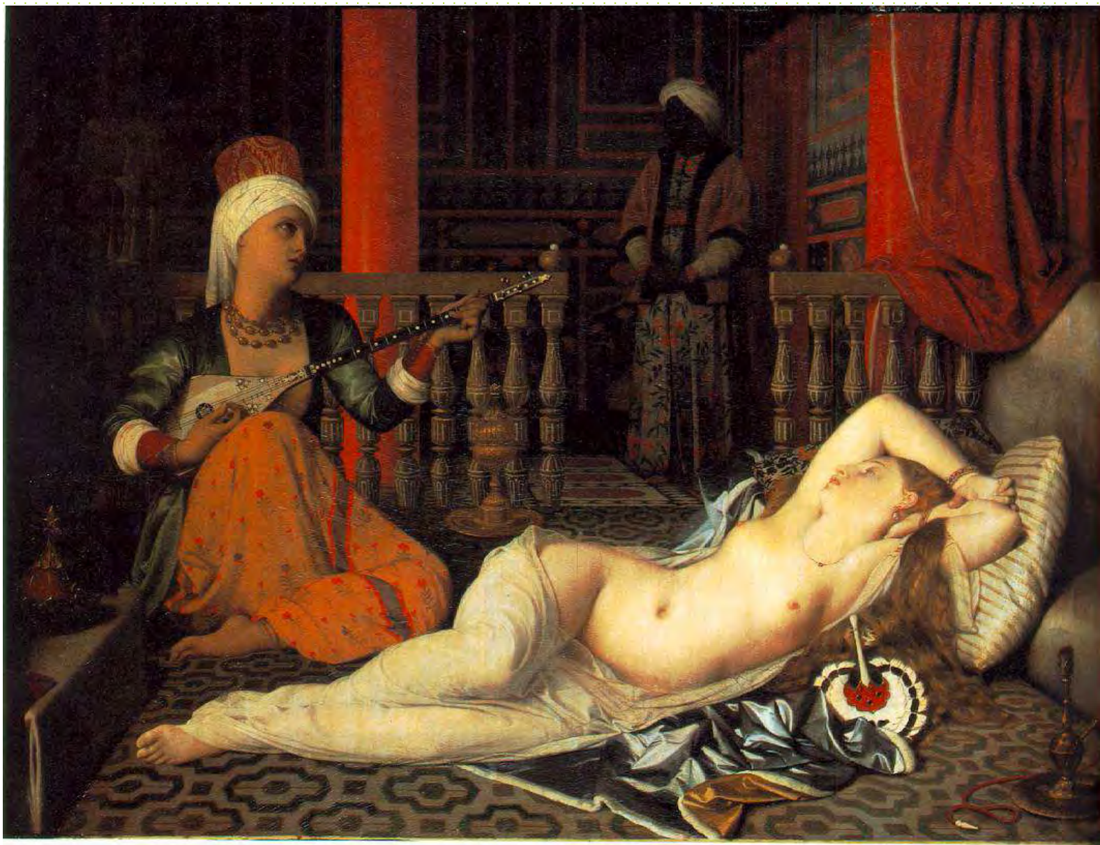
Jean August Dominique Ingres (1780-1867), Odaliska s otrokyní , 1840, olej, plátno, Fogg Art Museum, Harvard University, Cambridge, Massachusetts