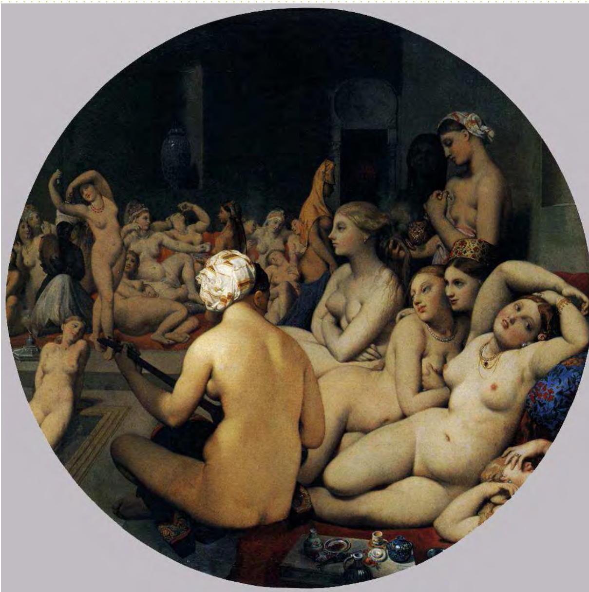
Jean August Dominique Ingres (1780-1867), Turecké lázně, 1863, olej, plátno na dřevě, průměr 108 cm, Louvre, Paříž