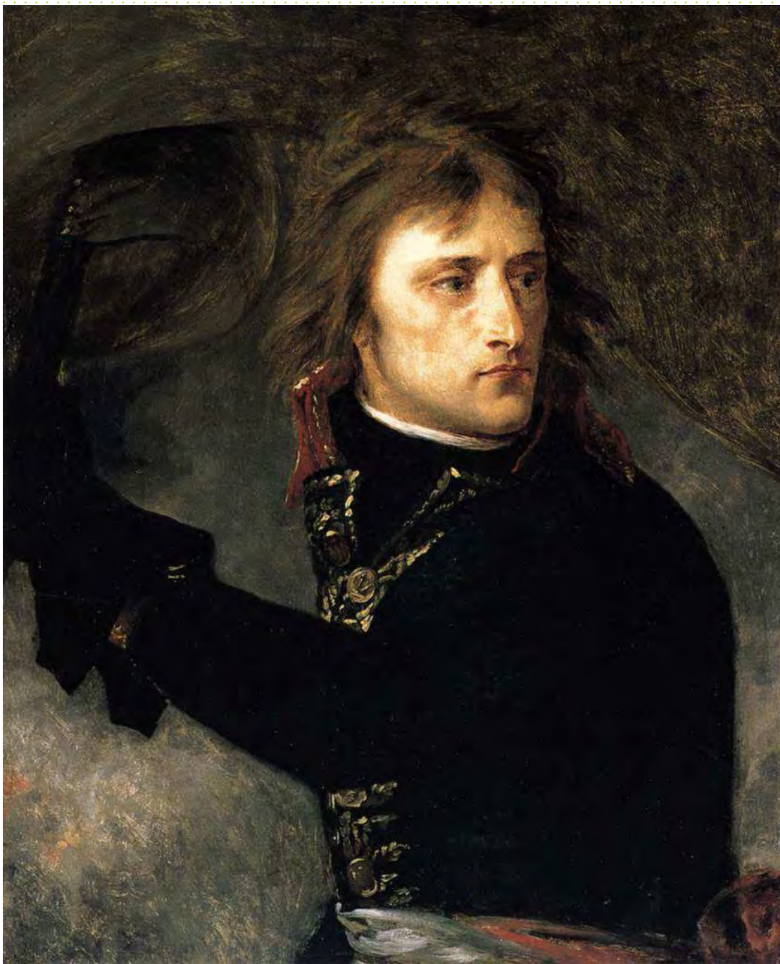
Antoine-Jean Gros (1771-1835), Bonaparte na arcolském mostě, 1796, olej, plátno, 73 x 59 cm, Louvre, Paříž