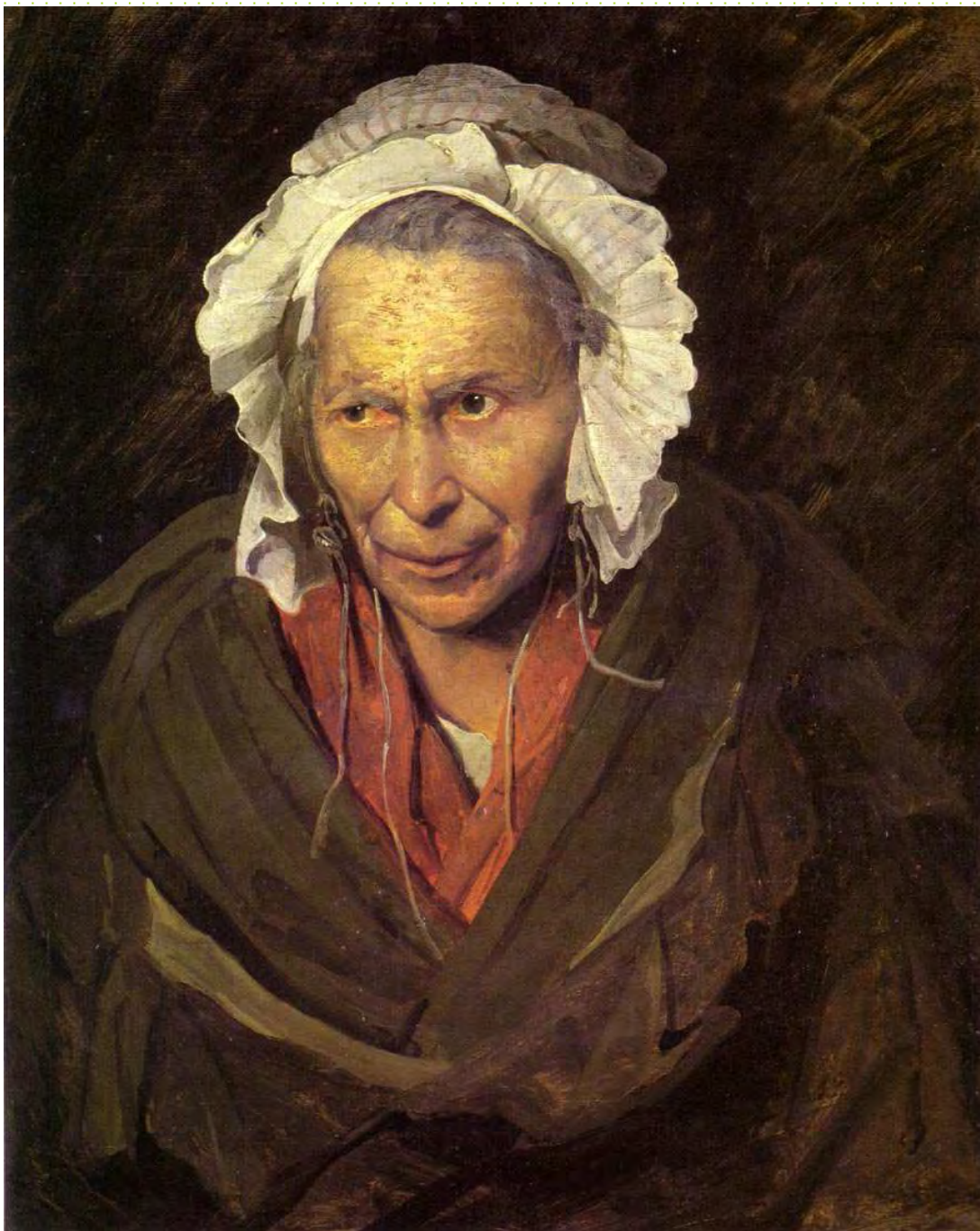
Théodor Géricault (1791-1824), Portrét ženy, postiženého chorobnou závistivostí, asi 1822, olej, plátno, 72 x 58 cm, Musée des Beaux-Arts, Lyons