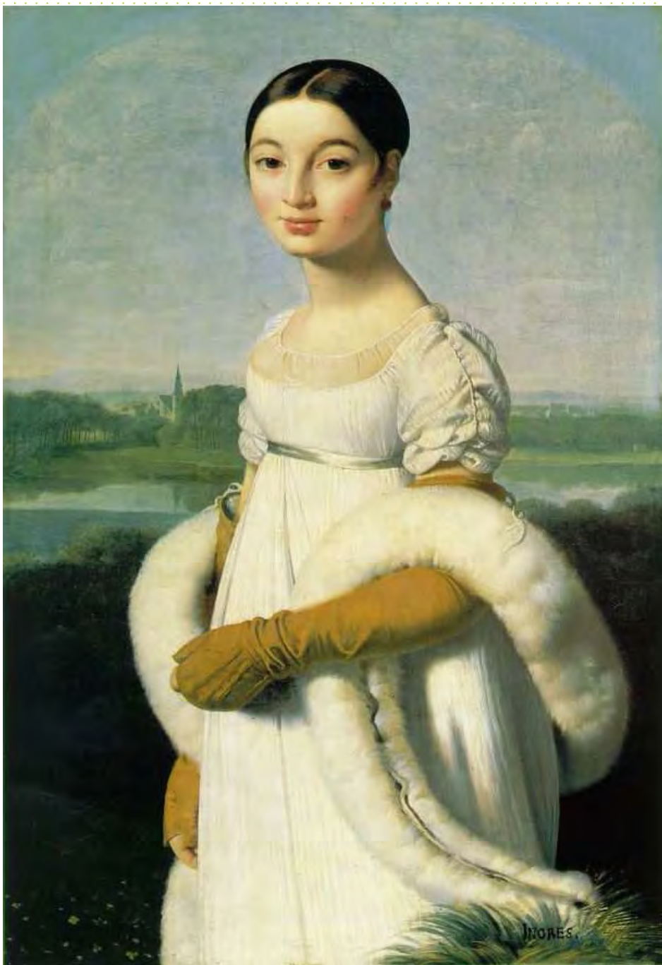
Jean August Dominique Ingres (1780-1867), Portrét slečny Caroline Rivièreové, 1805, olej, plátno, 100 x 70 cm, Louvre, Paříž