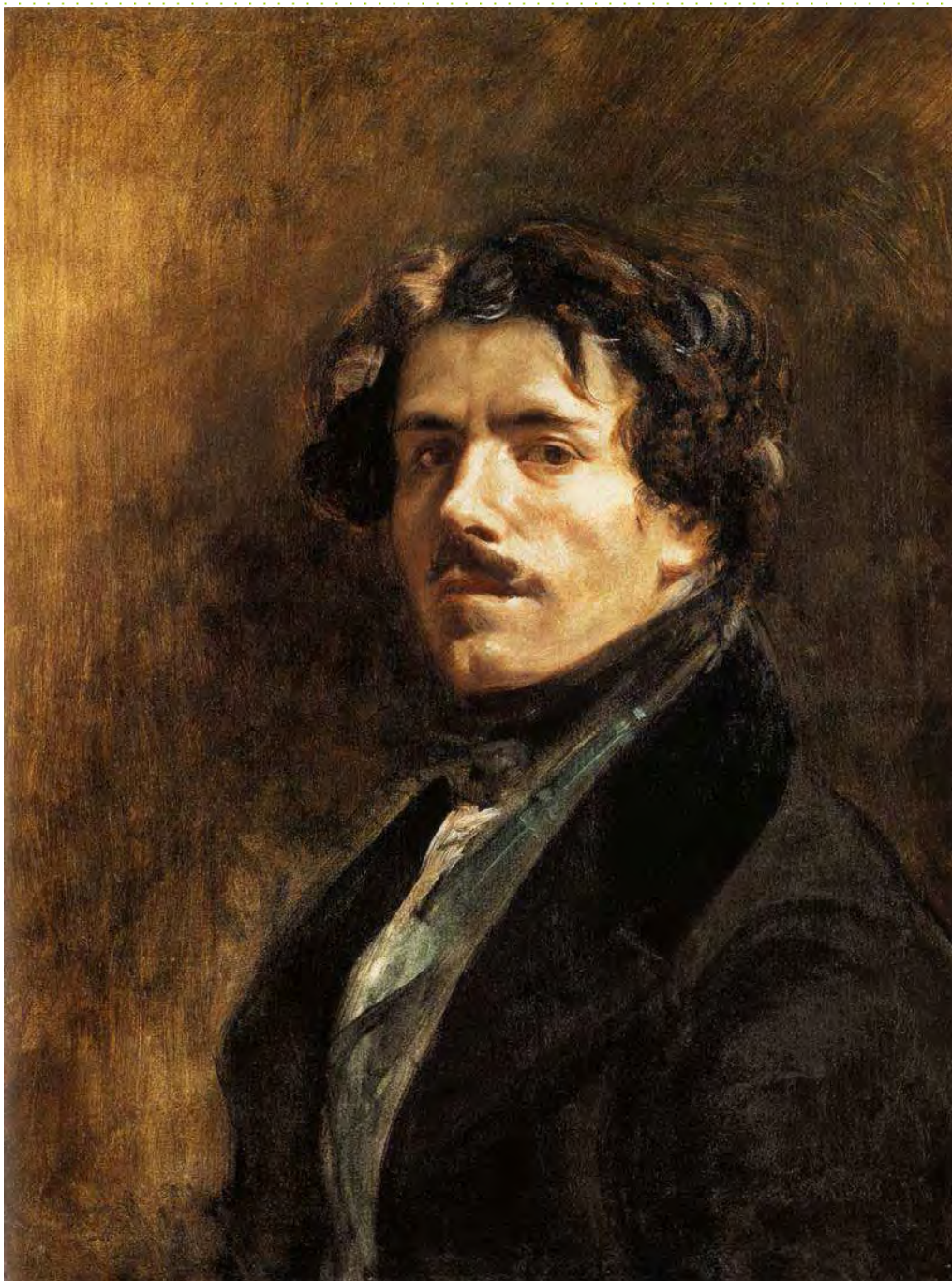
Eugène Delacroix (1798-1863), Vlastní podobizna, kolem 1837, olej, plátno, 65 x 54,5 cm, Louvre, Paříž