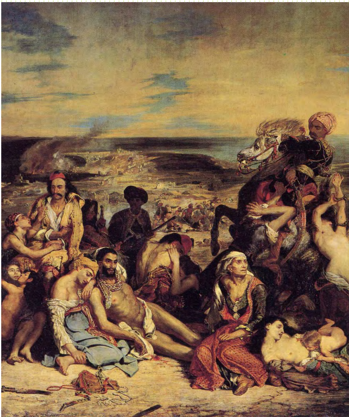
Eugène Delacroix (1798-1863), Masakr (Vražďení) na Chiu, vystaven 1824, olej, plátno, 417 x 354 cm, Louvre, Paříž