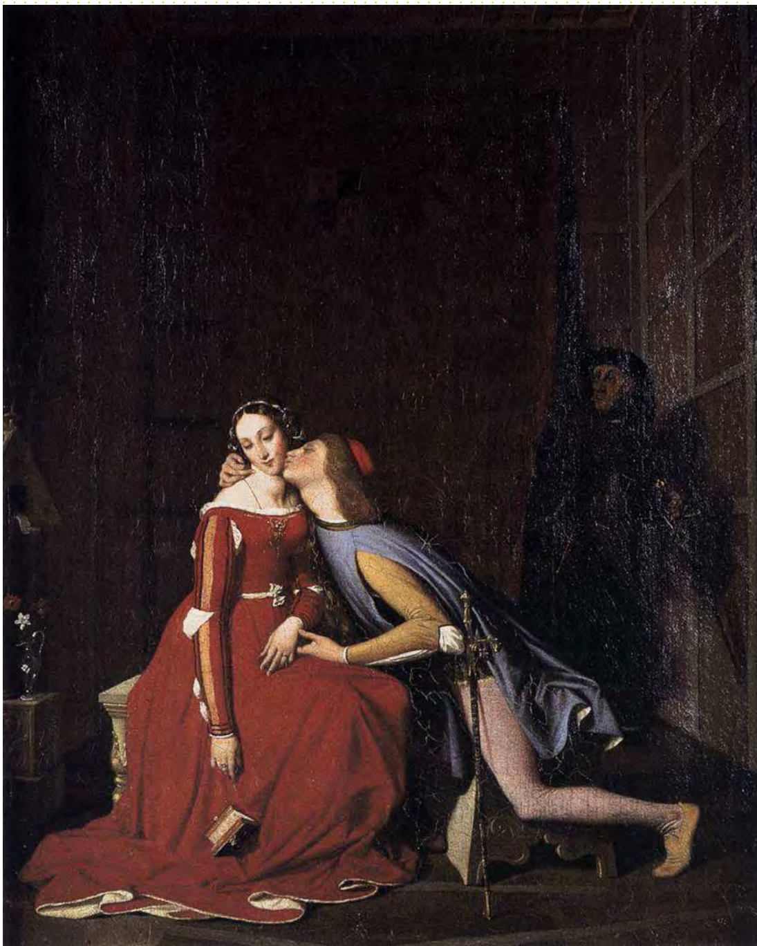
Jean August Dominique Ingres (1780-1867), Paolo a Francesca, 1819, olej, plátno, 480 x 390 cm, Angers, Musée des Beaux-Arts