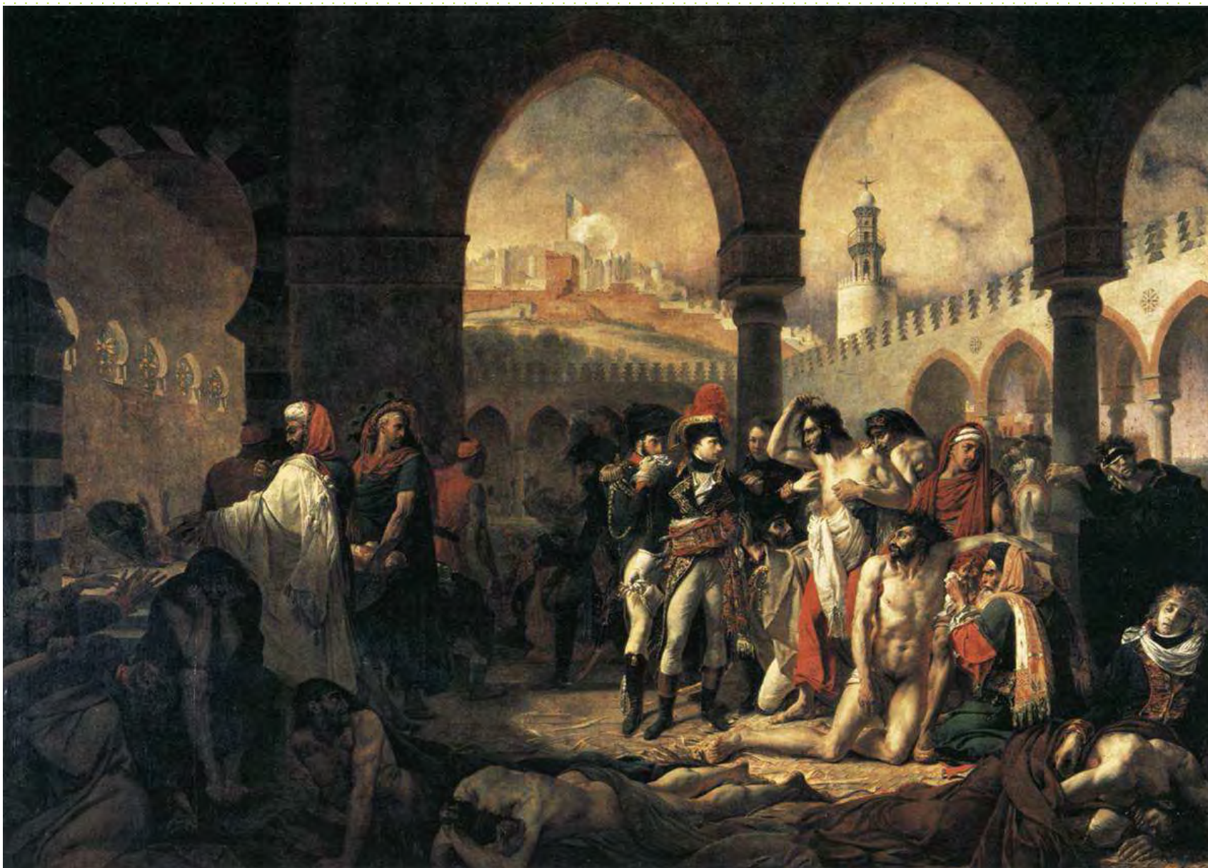
Antoine-Jean Gros (1771-1835), Napoleon na návštěvě u malomocných v Jaffě, 1804, olej, plátno, 523 x 715 cm, Louvre, Paříž