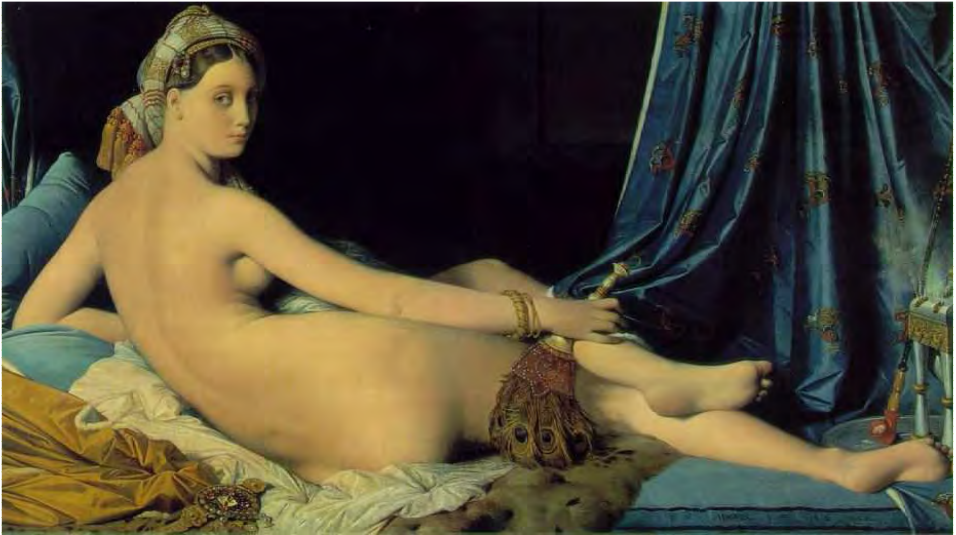
Jean August Dominique Ingres (1780-1867), Velká odaliska, olej, plátno, 1814, 91 x 162 cm, Louvre, Paříž