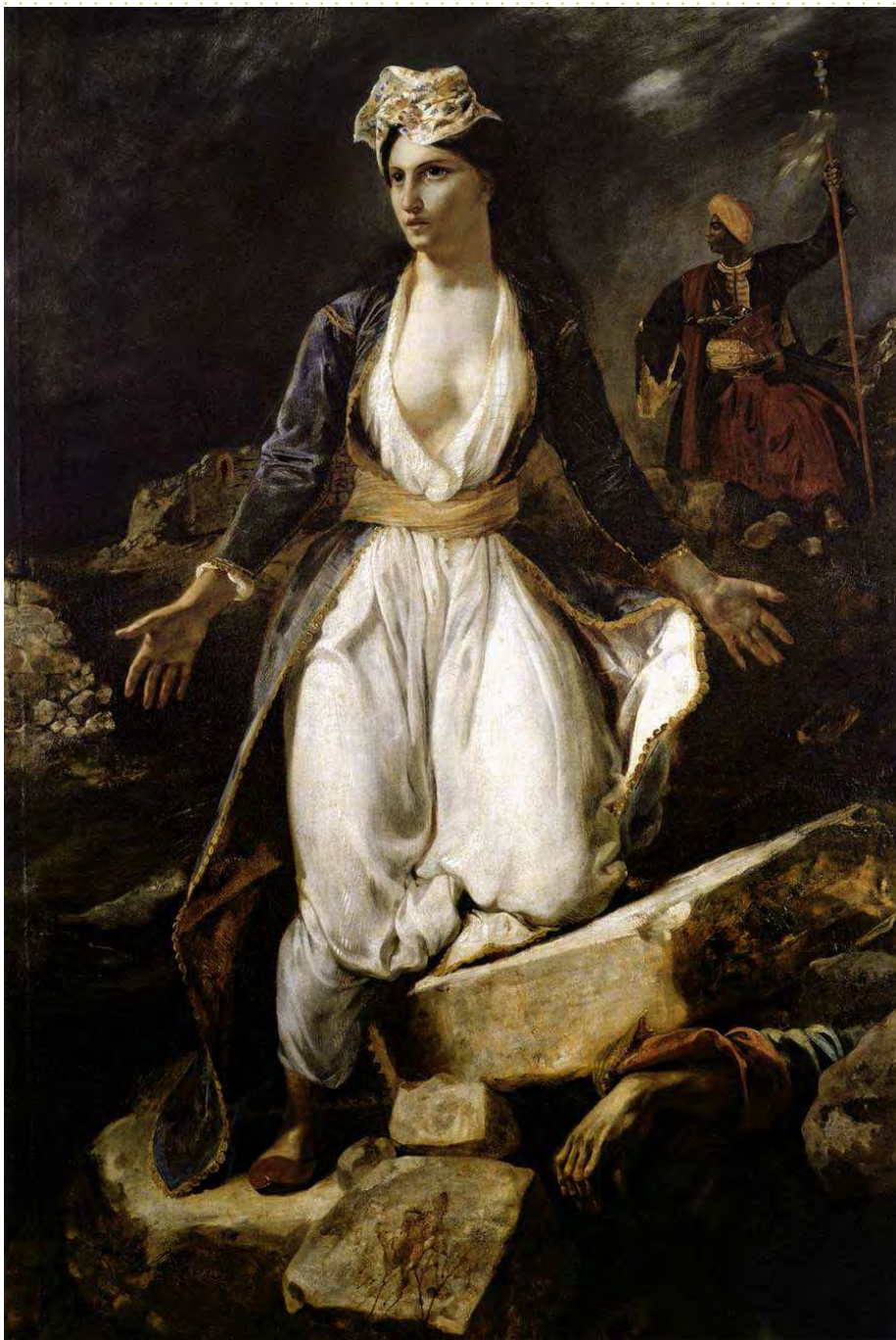
Eugène Delacroix (1798-1863), Řecko hynoucí na ruinách Missolonghi , 1826, op, 209 x 147 cm, Musée des Beaux-Arts, Bordeaux