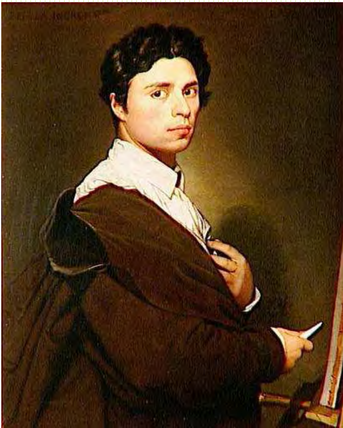
Jean August Dominique Ingres (1780-1867), Vlastní podobizna, 1804, Musée Condé, Chantilly