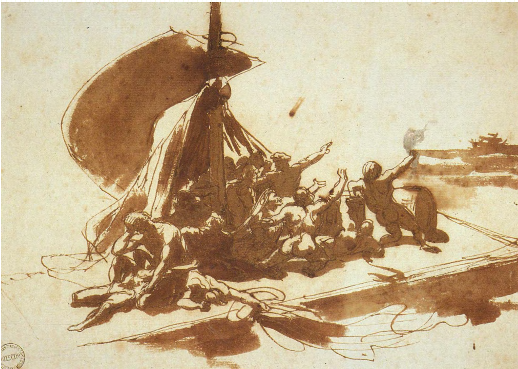
Théodor Géricault (1791-1824), Prám Medúzy - studie, lavírovaná kresba perem, papír, 20,3 x 28,7 cm, Musée des Beaux-Arts et de la Céramique, Rouen