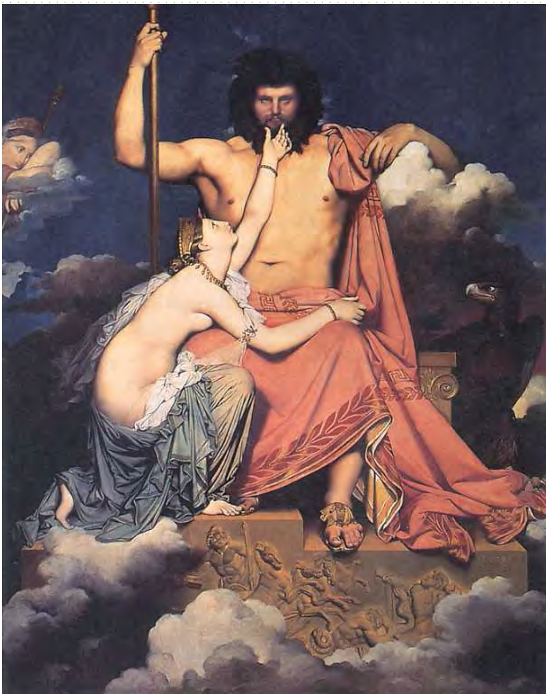
Jean August Dominique Ingres (1780-1867), Zeus a Tétis, 1811, olej, plátno, 327 x 260 cm, Musée Granet, Aix-en-Provence