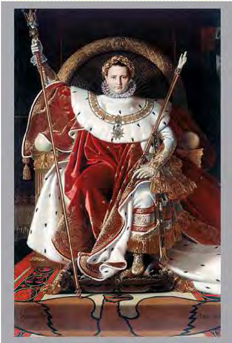
Jean August Dominique Ingres (1780-1867), Napoleon I. na císařském trůnu, 1806, olej, plátno, Musée de l'Armée, Paříž + detail