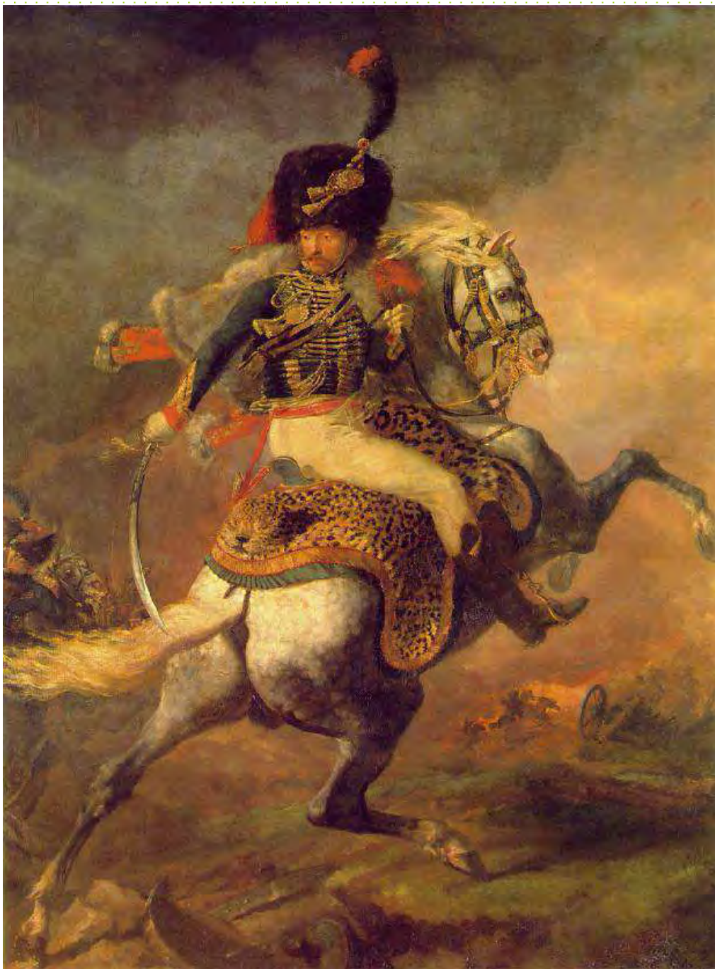
Théodor Géricault (1791-1824), Důstojník gardových myslivců při útoku, 1812, olej, plátno, 349 x 266 cm, Louvre, Paříž