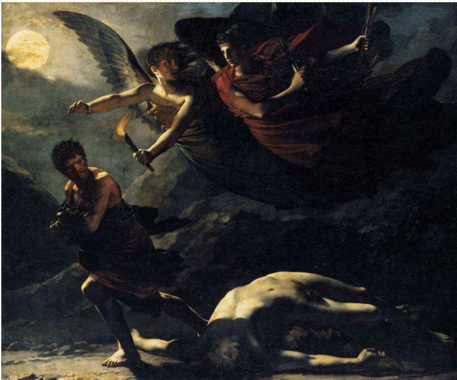
Pierre-Paul Prud'hon (1758-1823), Spravedlnost a Pomsta pronásledují zločin, 1808, olej, plátno, 244 x 294 cm, Louvre, Paříž