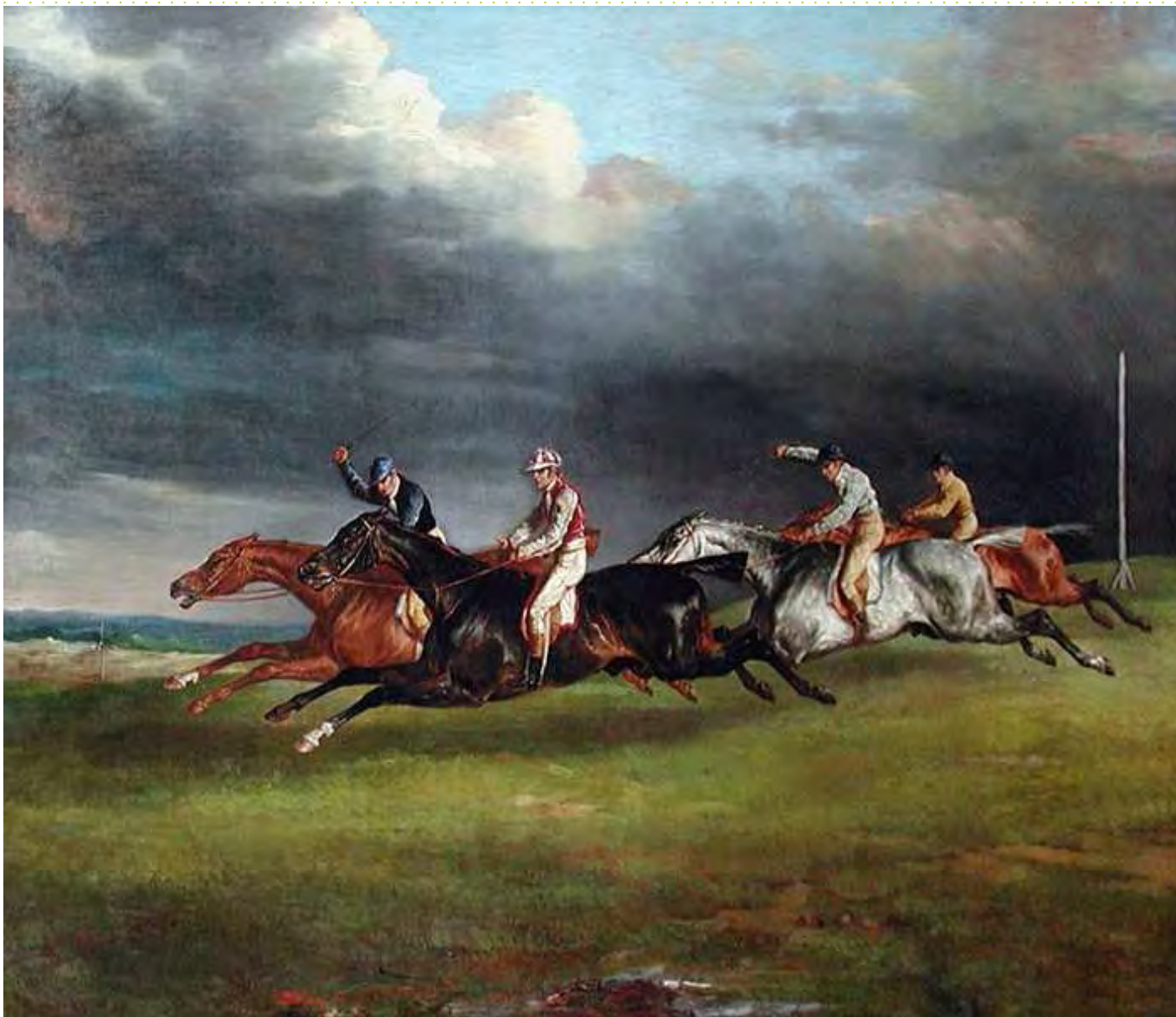
Théodor Géricault (1791-1824), Derby v Epsomu, 1821, olej, plátno, 92 x 122 cm, Louvre, Paříž