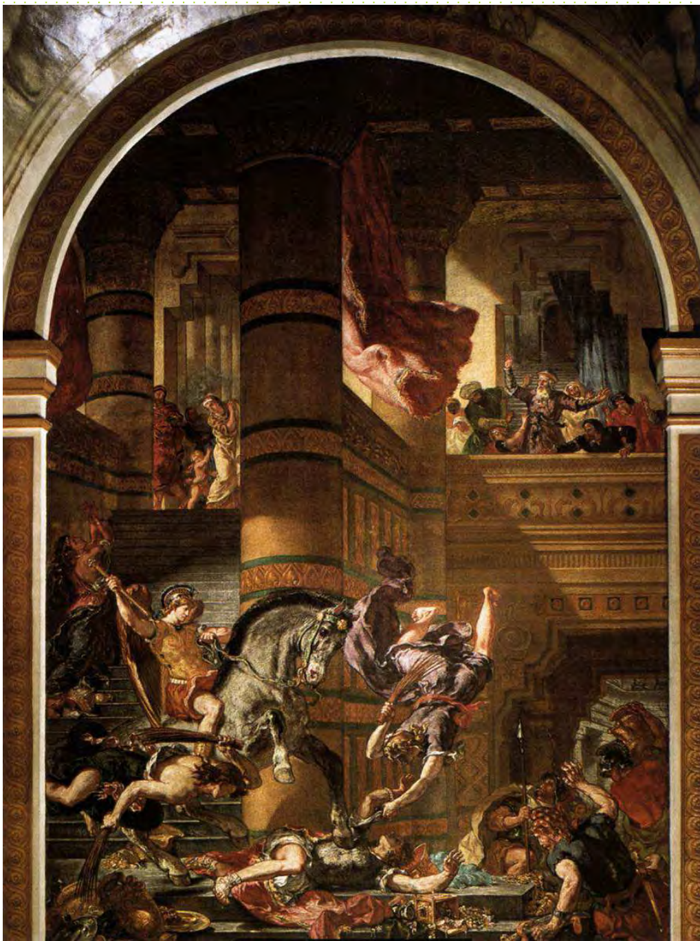
Eugène Delacroix (1798-1863), Vyhnaní Heliodora z chrámu, 1854-1861, olej, enkaustika, 751 x 485 cm, Saint-Sulpice, Paříž