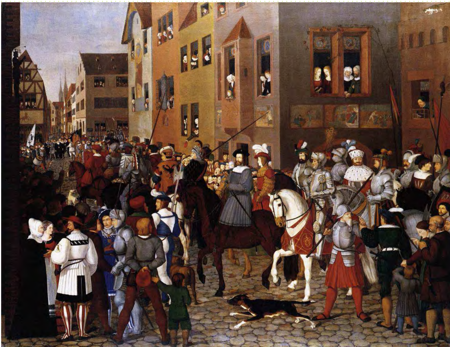
Franz Pforr (1788-1812), Vjezd Rudolfa Habsburského do Basileje v roce 1273, 1808-1810, olej, plátno, 90,5 x 118,9 cm, Städelsches Kunstinstitut, Frankfurt nad Mohanem