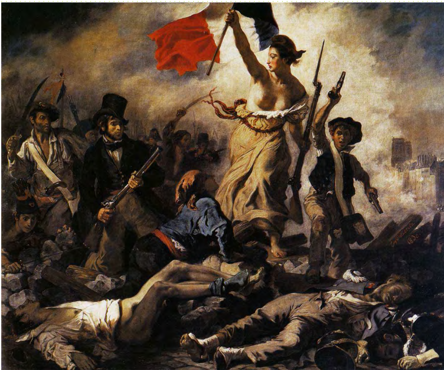
Eugène Delacroix (1798-1863), Svoboda vedoucí lid (na barikádu), 1830, olej, plátno, 260 x 325 cm, Louvre, Paříž