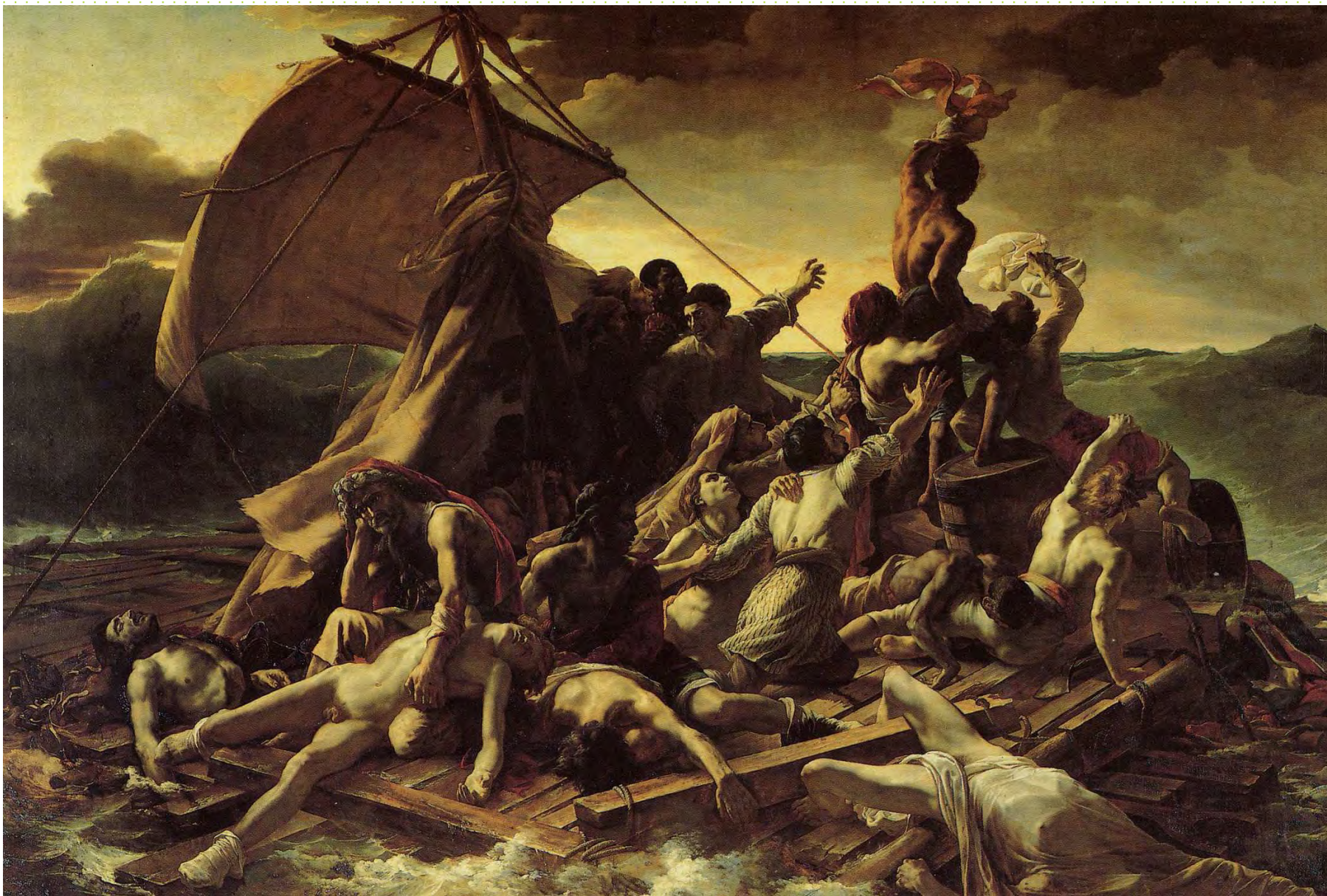
Théodor Géricault (1791-1824), Prám Medúzy, 1818-1819, olej, plátno, 491 x 716 cm, Louvre, Paříž