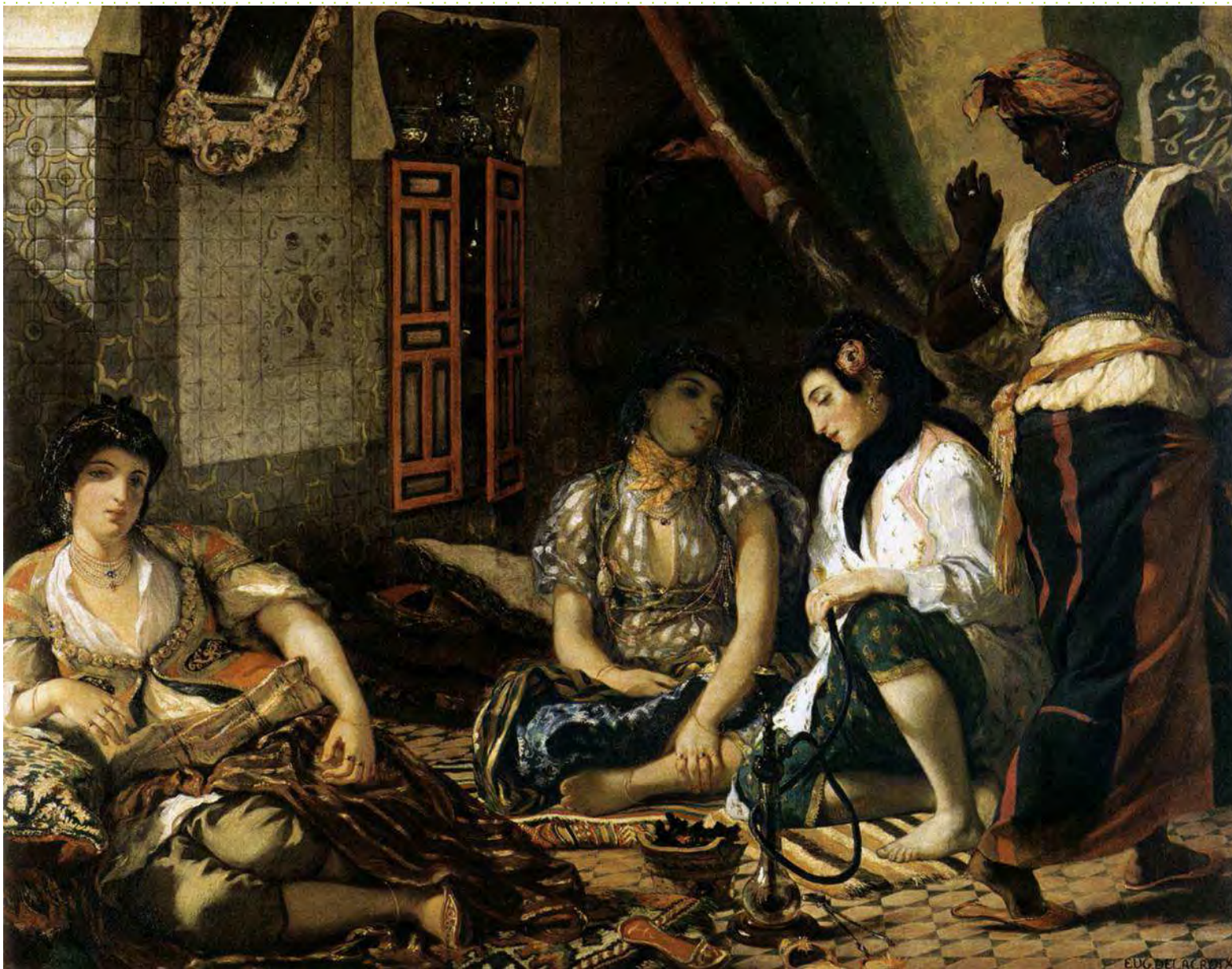
Eugène Delacroix (1798-1863), Alžírské ženy, 1834, 180 x 229 cm, olej, plátno, 260 x 325 cm, Louvre, Paříž