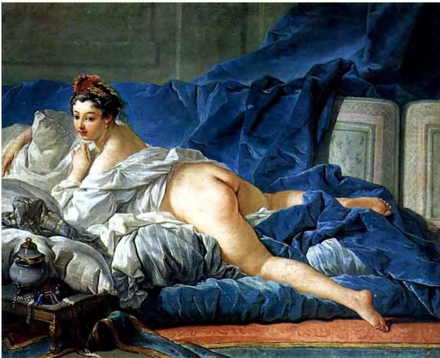
François Boucher (1703-1770), Odaliska, 1753, olej, plátno, 53,5 x 64,5 cm, Louvre, Paříž