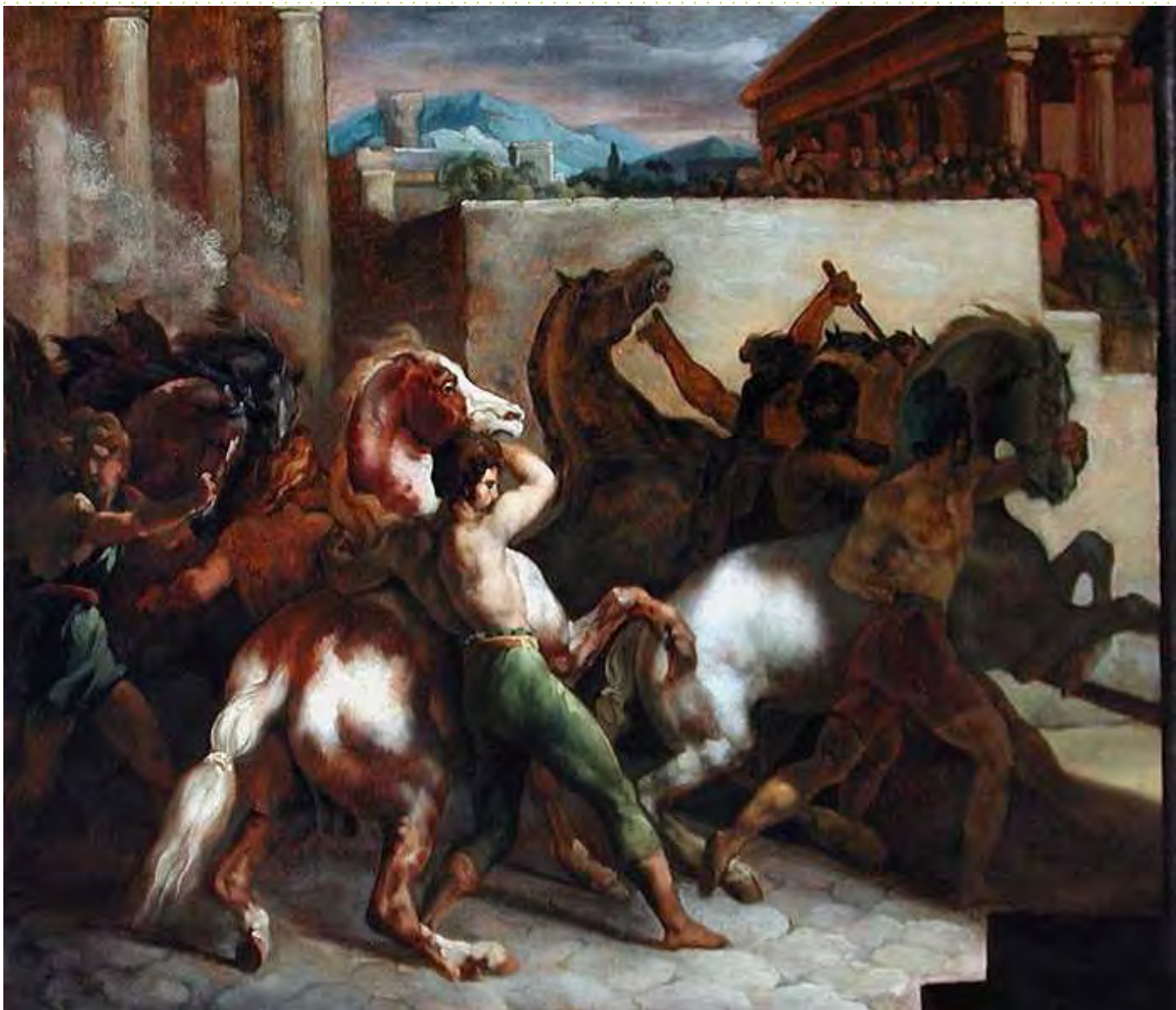
Théodor Géricault (1791-1824), Závody divokých koní v Římě, kolem 1817, olej, plátno, 45 x 60 cm, Louvre, Paříž