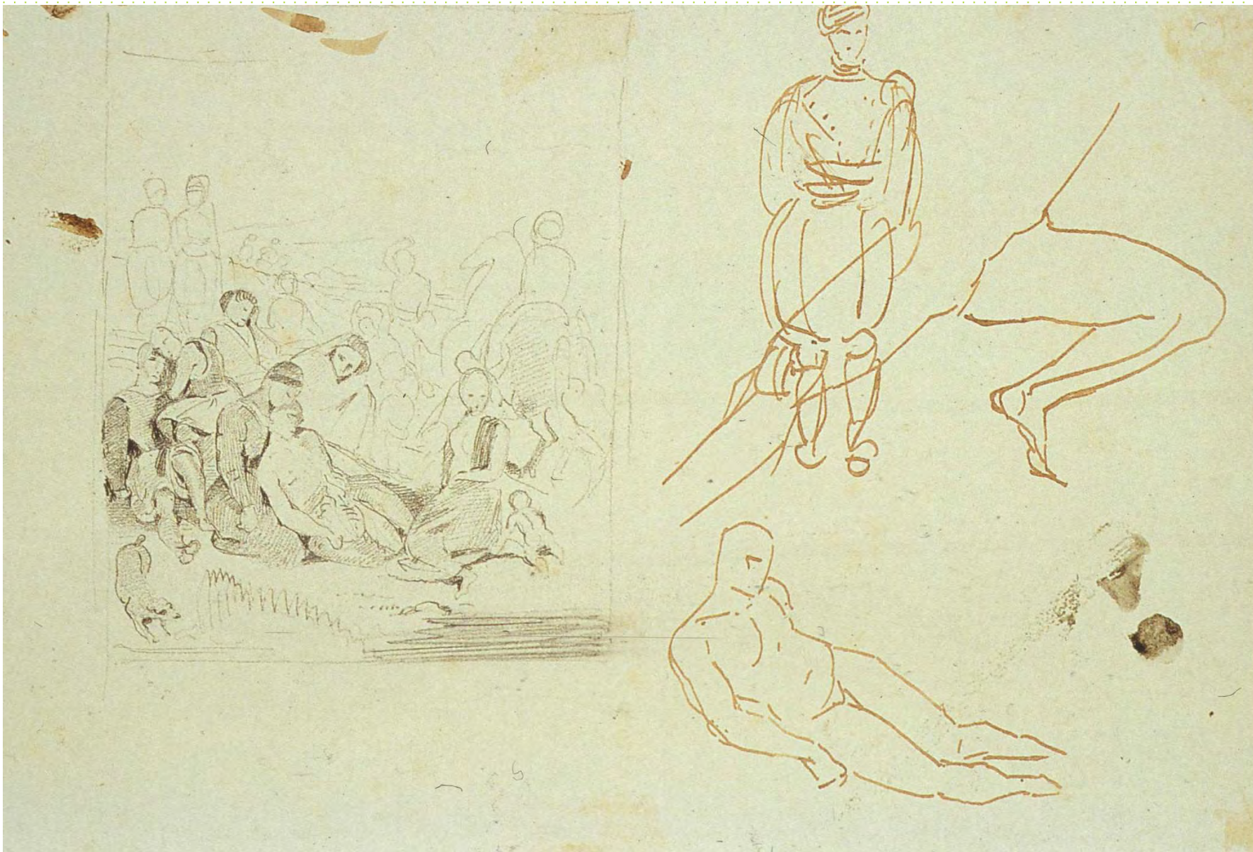
Eugène Delacroix (1798-1863), Masakr (Vražďení) na Chiu – celková studie, 1824, tužka, papír, 19,9 x 30,7 cm, Louvre, Paříž