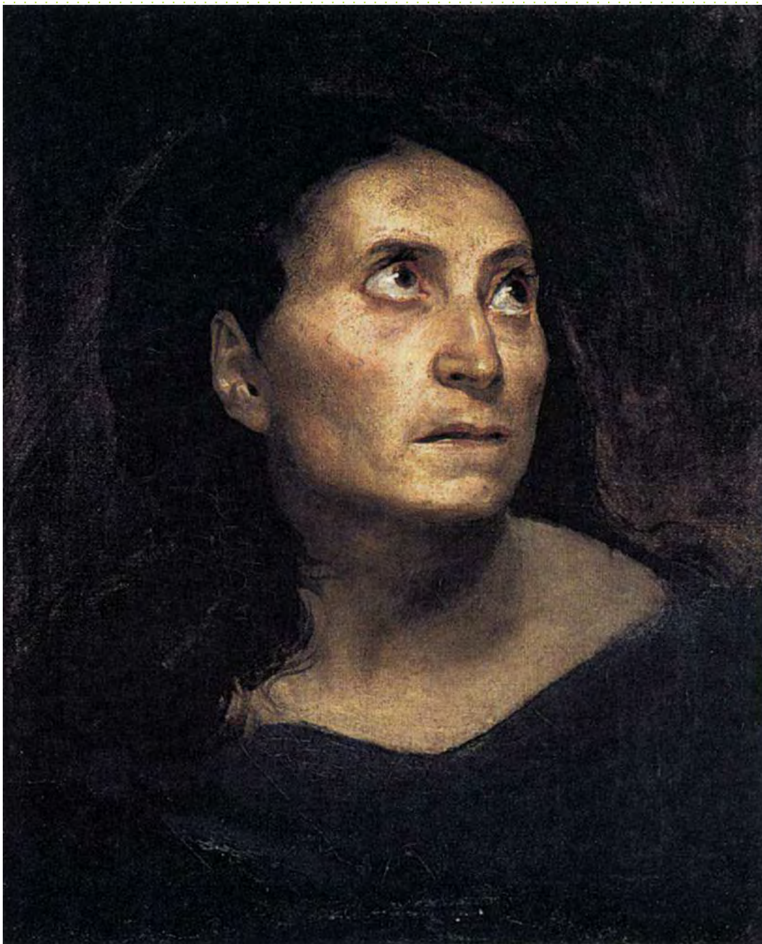
Eugène Delacroix (1798-1863), Duševně chorá žena, kolem 1822, olej, plátno, 41 x 33 cm, Musée des Beaux-Arts, Orléans