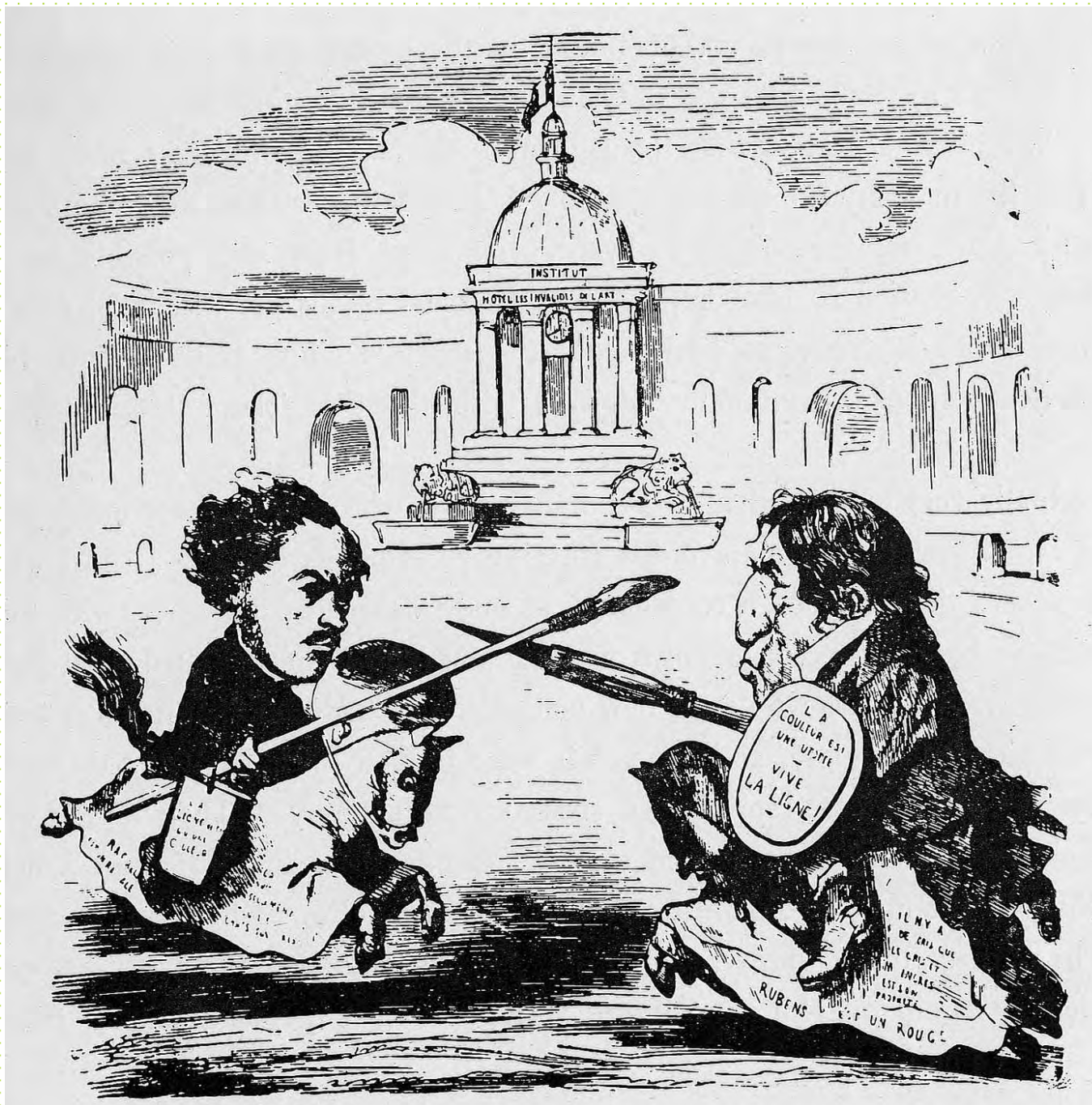
Karikatura: souboj Delacroix a Ingrese před budovou Institut de France, 1840- 1860, rytina, papír