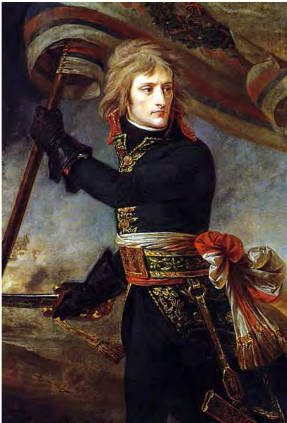
Antoine-Jean Gros (1771-1835), Bonaparte na arcolském mostě, 1796, olej, plátno, 73 x 59 cm, Versailles, Paříž