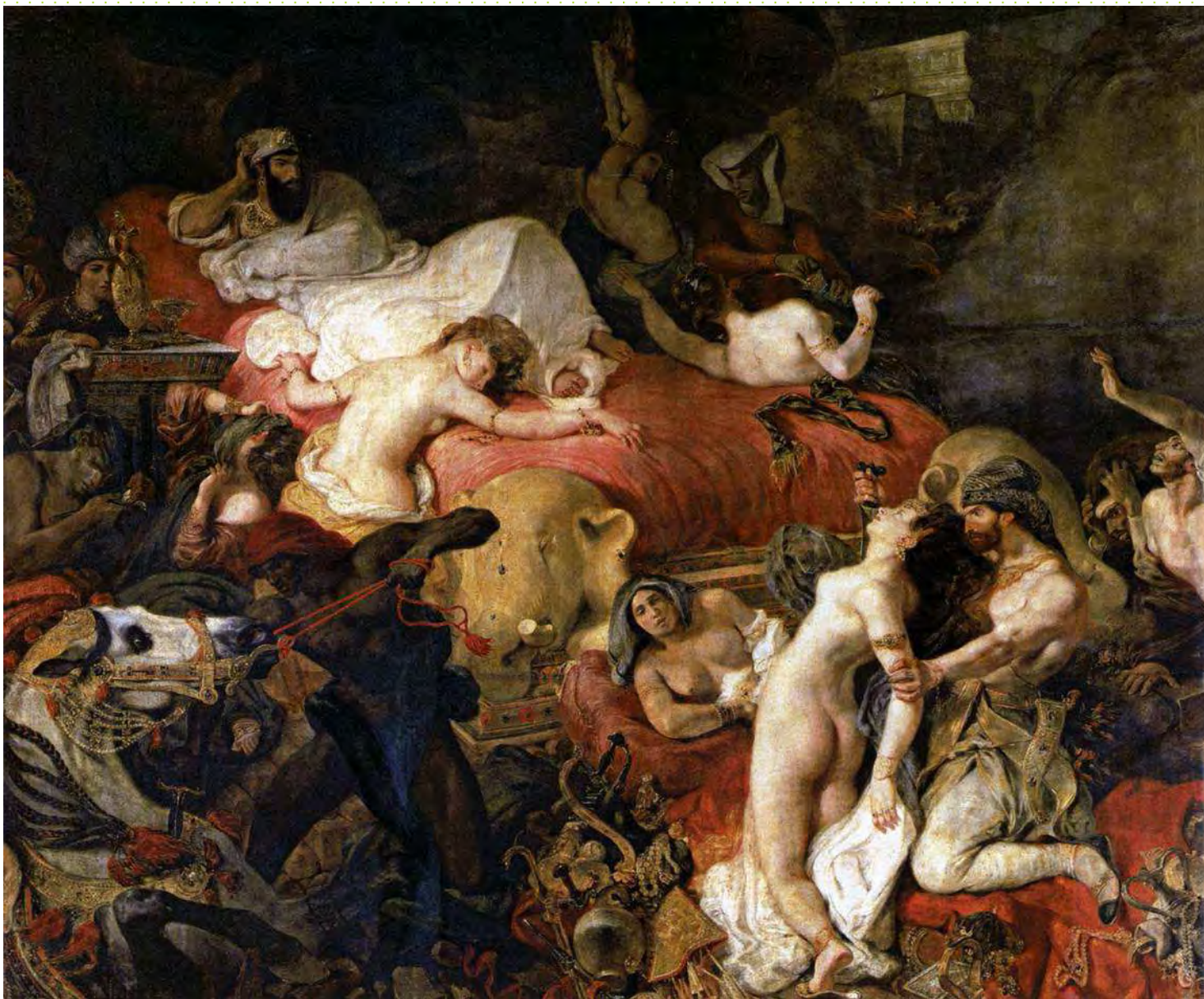
Eugène Delacroix (1798-1863), Smrt Sardanapala, 1827, olej, plátno, 392 x 496 cm, Louvre, Paříž