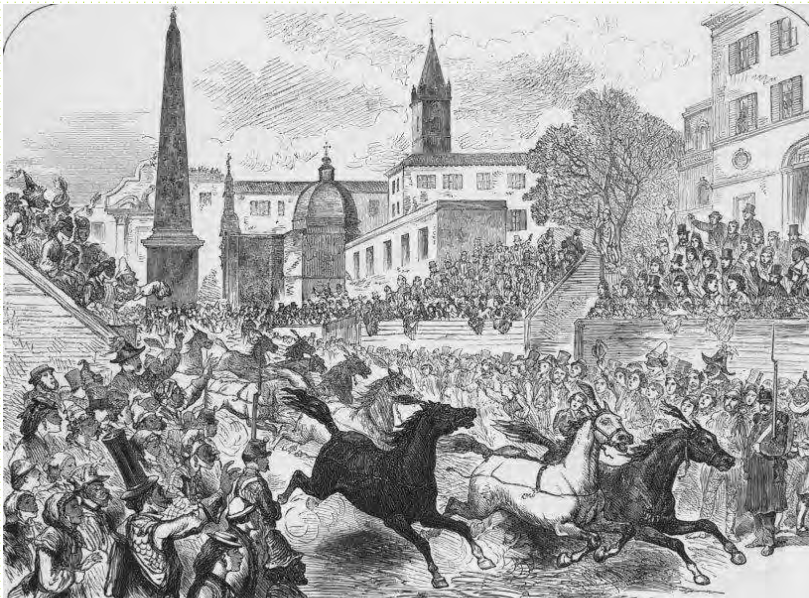
Karnevalový závod koní na Via del Corso v Římě, 1873, dřevoryt, papír