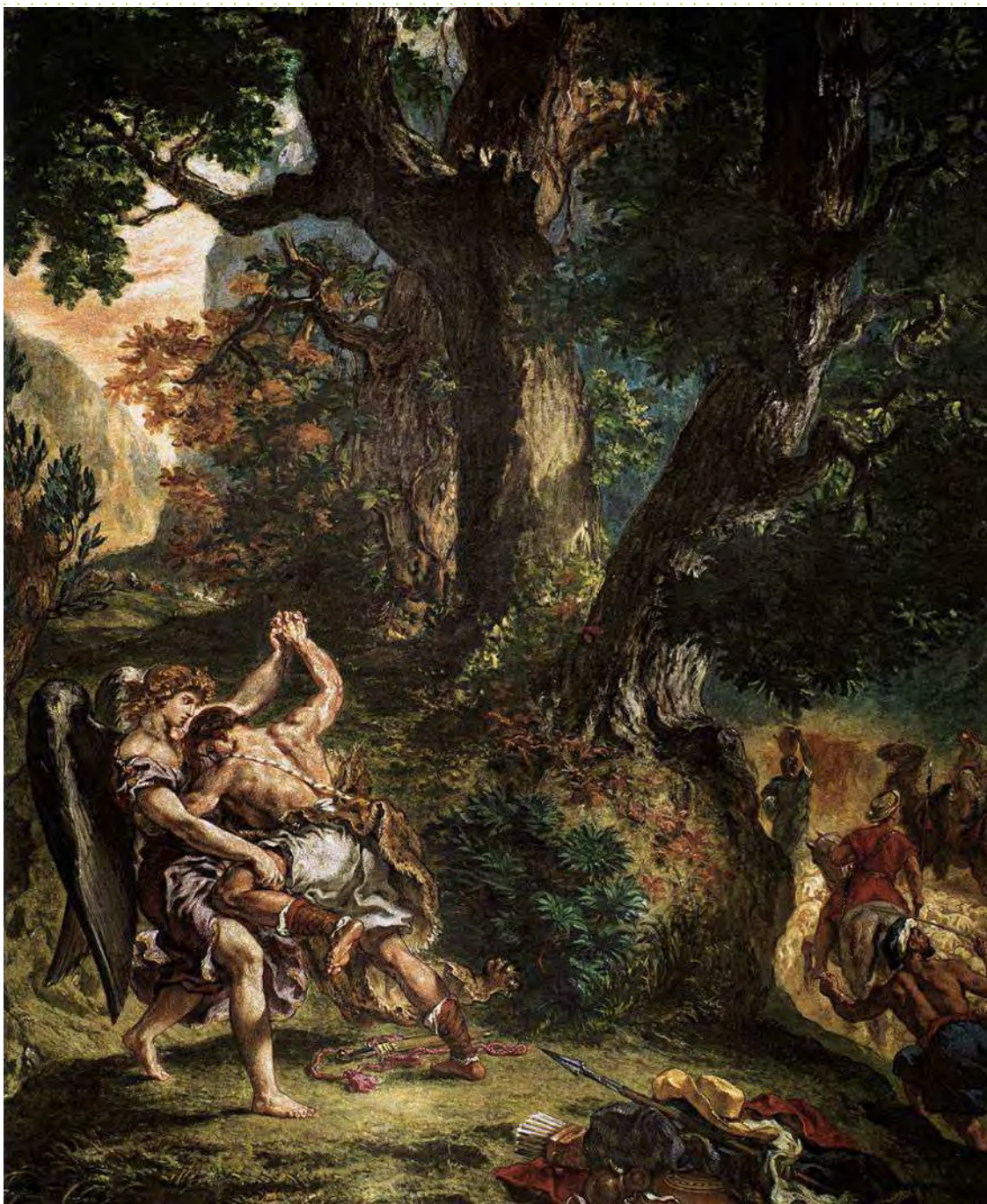
Eugène Delacroix (1798-1863), Zápas Jákoba s andělem (detail), 1854-61, olej, enkaustika, 751 x 485 cm (celek), Saint-Sulpice, Paříž