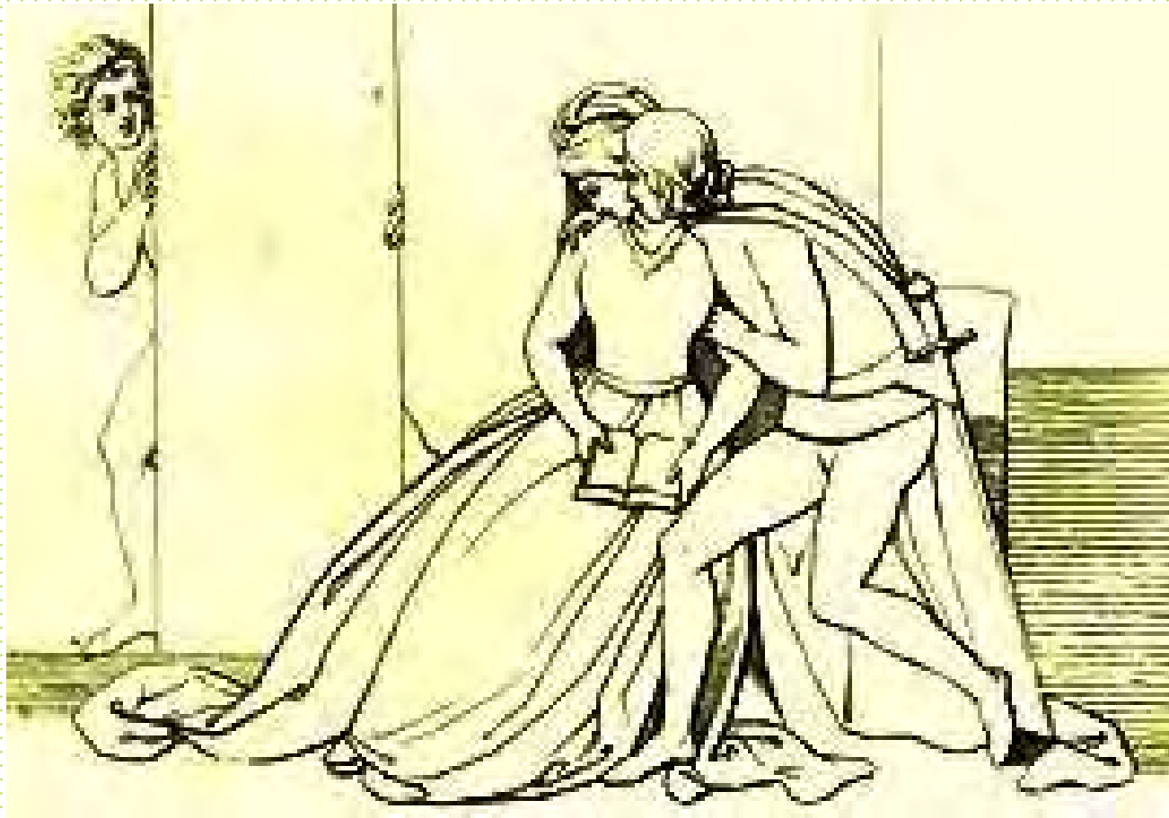
John Flaxman, Paolo e Francesca, 1802, Biblioteca Comunale dell'Archigginasio, Bologna