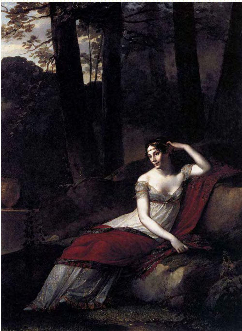
Pierre-Paul Prud'hon (1758-1823), Podobizna císařovny Josefíny, 1805, olej, plátno, 244 x 179 cm, Louvre, Paříž