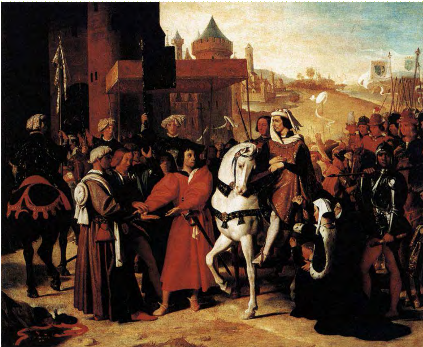
Jean August Dominique Ingres (1780-1867), Vjezd následníka trůnu, pozdějšího krále Karla V., do Paříže v roce 1358, 1821, olej, plátno, 470 x 560 cm, Wadsworth Atheneum, Hartford