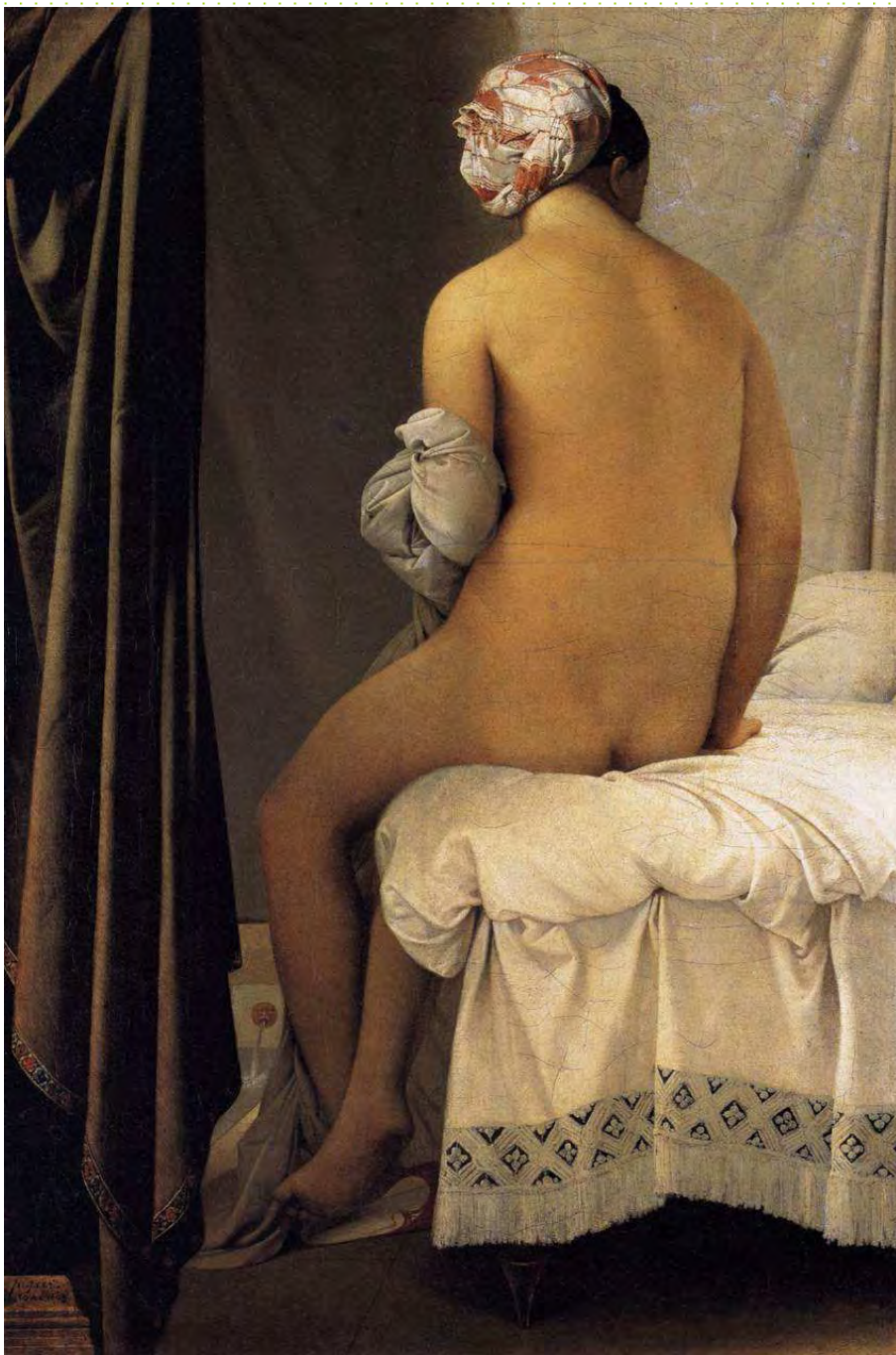
Jean August Dominique Ingres (1780-1867), „Grande Baigneuse“ – Koupající se, 1808, olej, plátno, 146 x 97 cm, Louvre, Paříž