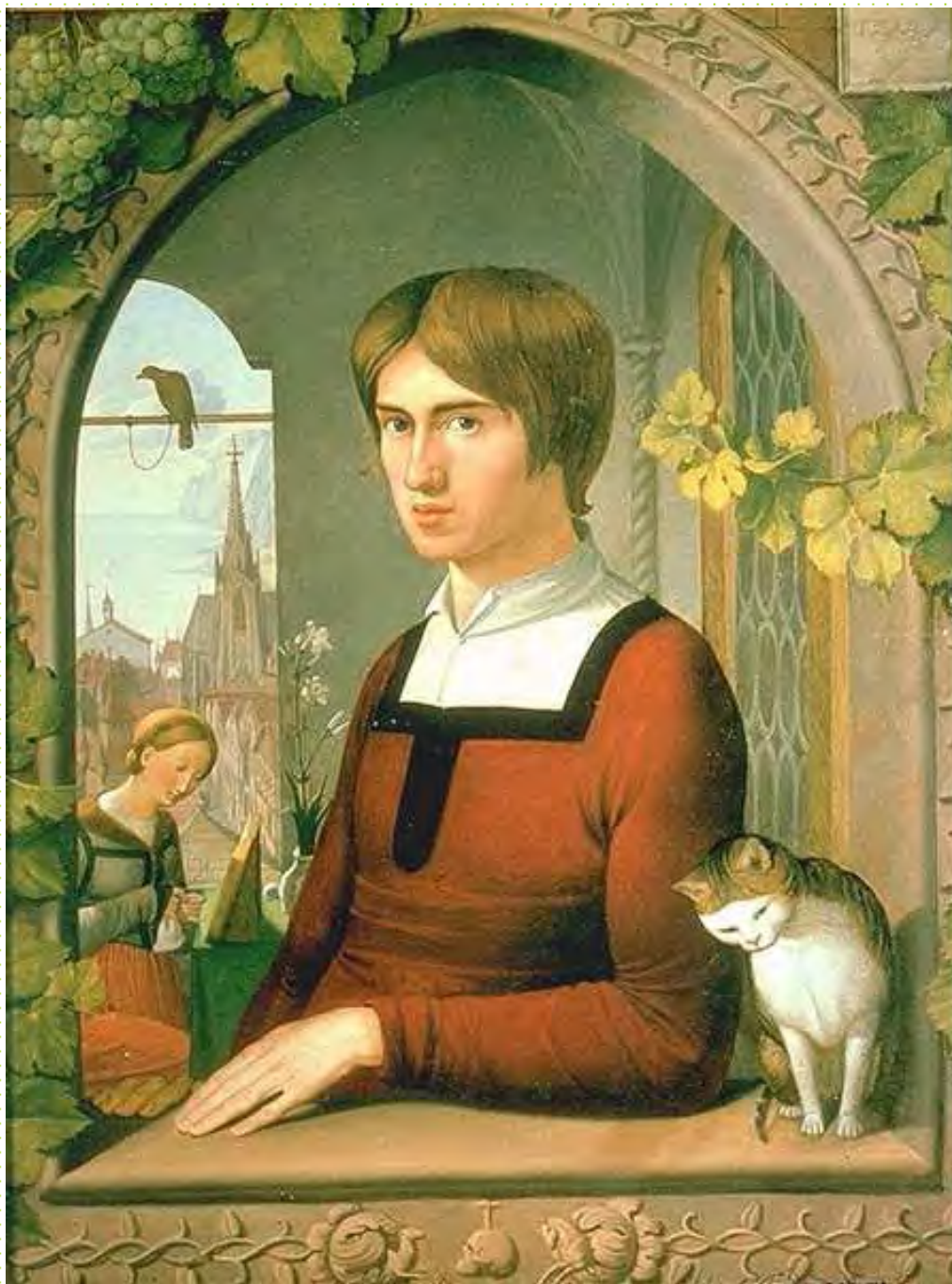
Johann Friedrich Overbeck (1789-1869), Podobizna Franze Pforra, kol. 1810, olej, plátno, 62 x 47 cm, Nationalgalerie, Berlín