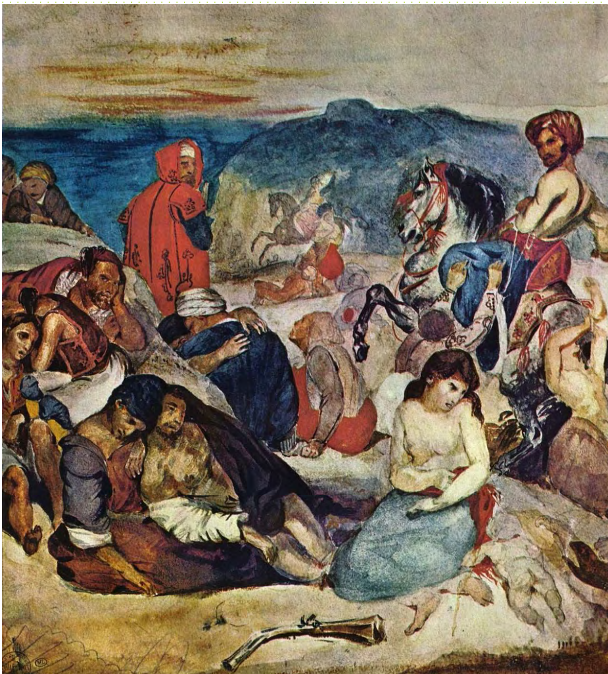
Eugène Delacroix (1798-1863), Masakr (Vražďení) na Chiu – celková studie, 1824, akvarel, tužka, papír, 34 x 30 cm, Louvre, Paříž