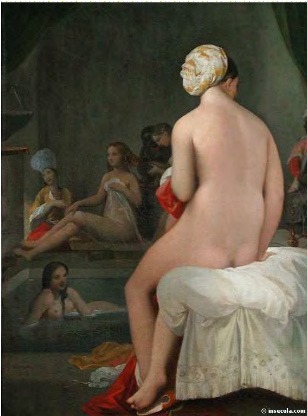
Jean August Dominique Ingres (1780-1867), „La petite baigneuse“ – interiér harému, 1828, olej, plátno, 35 x 27 cm, Louvre, Paříž