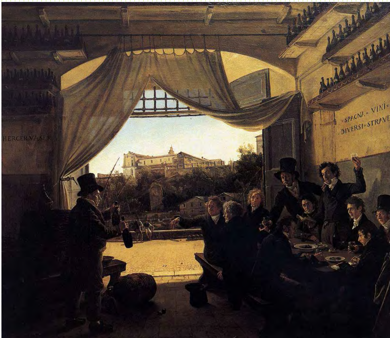
Franz Ludwig Catel (1778-1856), Korunní princ Ludvík ve španělské vinárně v Římě, 1824, olej, plátno, Neue Pinakothek, Mnichov