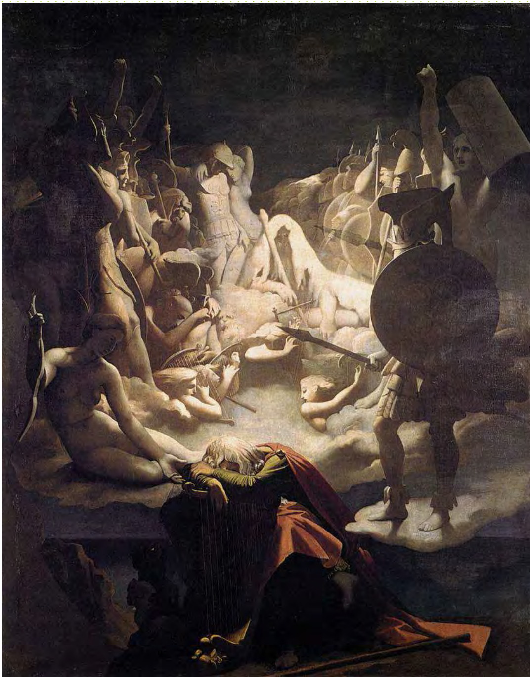
Jean August Dominique Ingres (1780-1867), Sen Ossianův, 1813, olej, plátno, 348 x 275 cm, Musée Ingres, Montauban