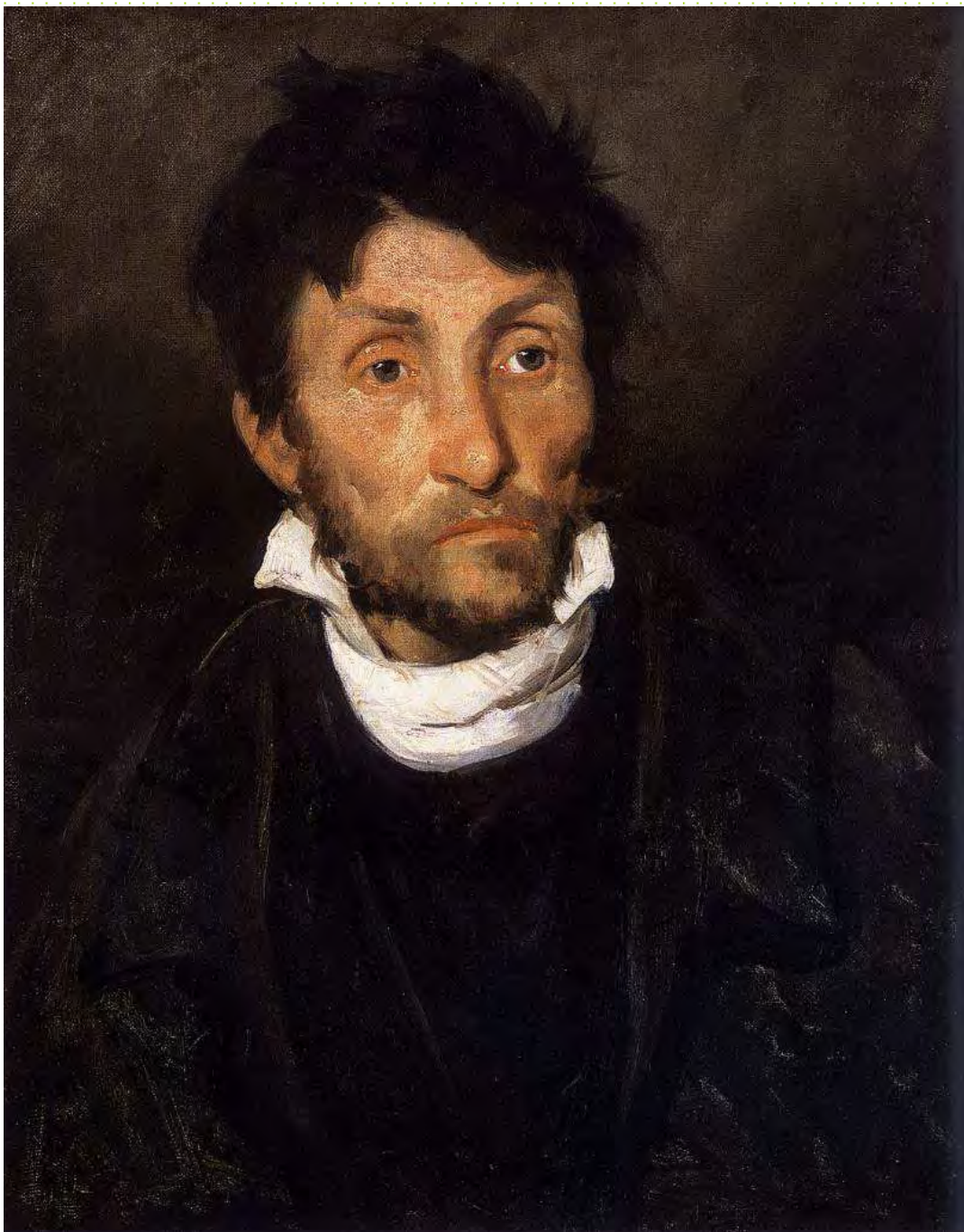
Théodor Géricault (1791-1824), Portrét muže, postiženého kleptomanií, asi 1820, olej, plátno, 61,2 x 50,2 cm, Museum voor Schone Kunsten, Ghent