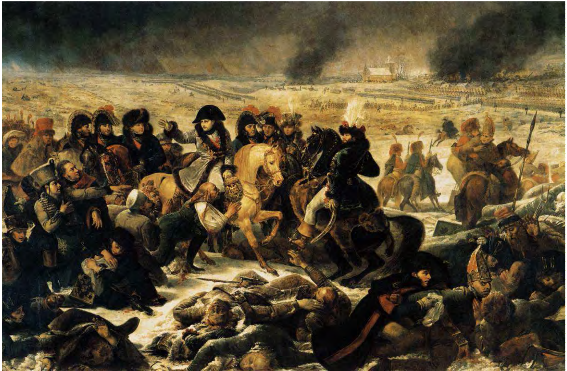
Antoine-Jean Gros (1771-1835), Napoleon u Jílového, 1808, olej, plátno, 533 x 800 cm, Louvre, Paříž