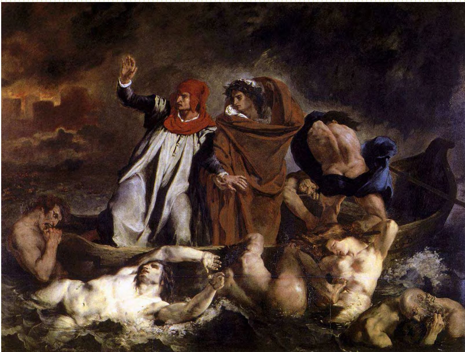
Eugène Delacroix (1798-1863), Dantova bárka, 1822, olej, plátno, 189 x 246 cm, Louvre, Paříž