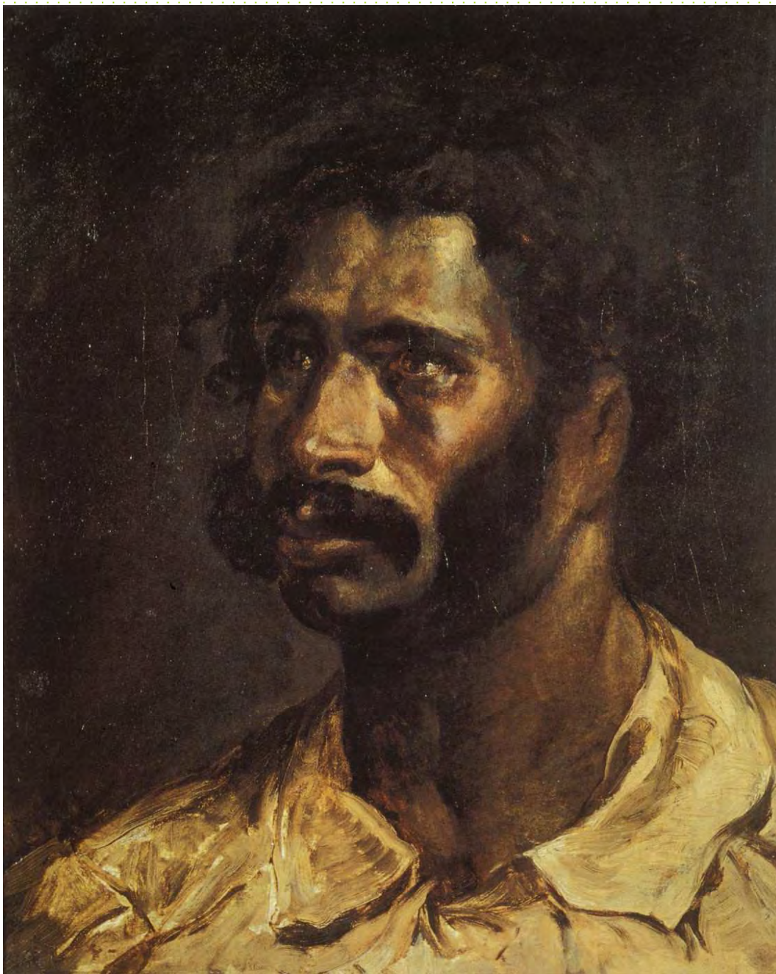
Théodor Géricault (1791-1824), Podobizna muže: Tesař lodi Medúza, olej, plátno, 46,5 x 39 cm, Musée des Beaux-Arts et de la Céramique, Rouen