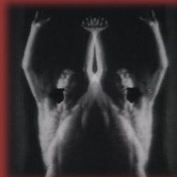
James Watson, Melville Weber: Lot in Sodom (1933, USA)