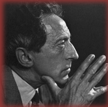
Jean Cocteau (1889–1963) Le Sang d'un poète (1930)