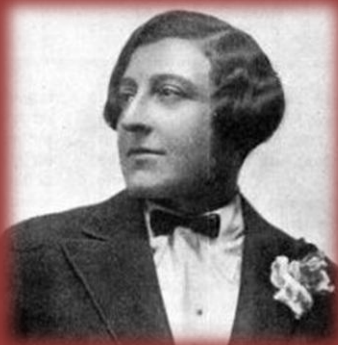
Germaine Dulac (1882–1942) La Sourinate Madame Beudet (1922) La Coquille et le Clergyman (1928)