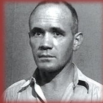
Jean Genet (1910–1986) Un chant d'amour (1950)