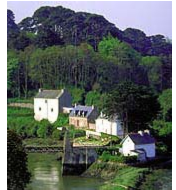
Hameau breton dans les Côtes d'Armor

Pays le plus étendu d'Europe occidentale (près d'un cinquième de la superficie de l'Union européenne), disposant d'une vaste zone maritime (zone économique exclusive s'étendant sur 11 millions de kilomètres carrés).