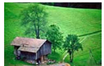
Grange savoyarde

Tandis que l'on dénombre 136 essences d'arbres en France, ce qui est exceptionnel pour un pays européen, le nombre de grands animaux va croissant : en 20 ans, la population de cerfs a doublé et celle de chevreuils a triplé.