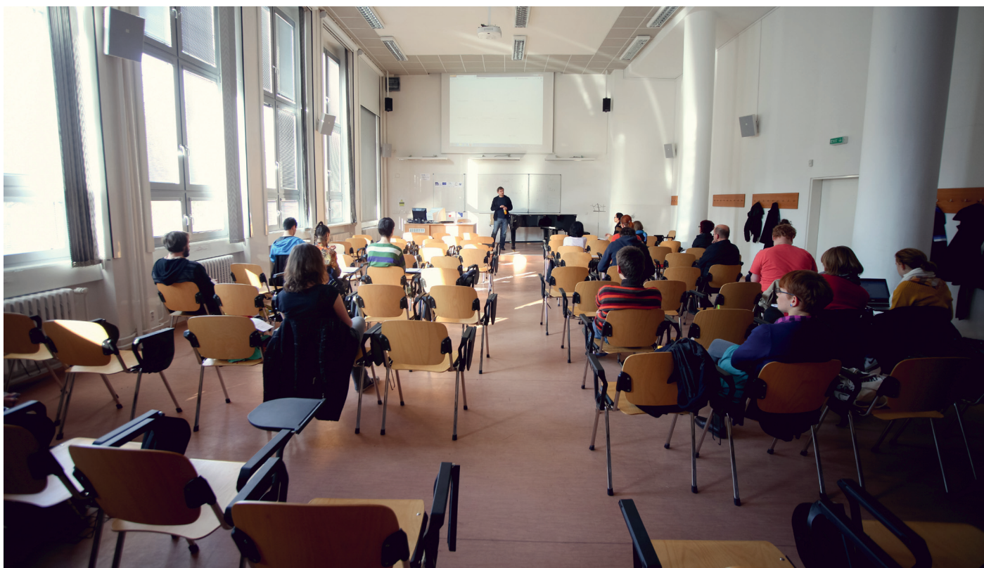
...a ještě jednou, tentokrát z jiného úhlu pohledu.