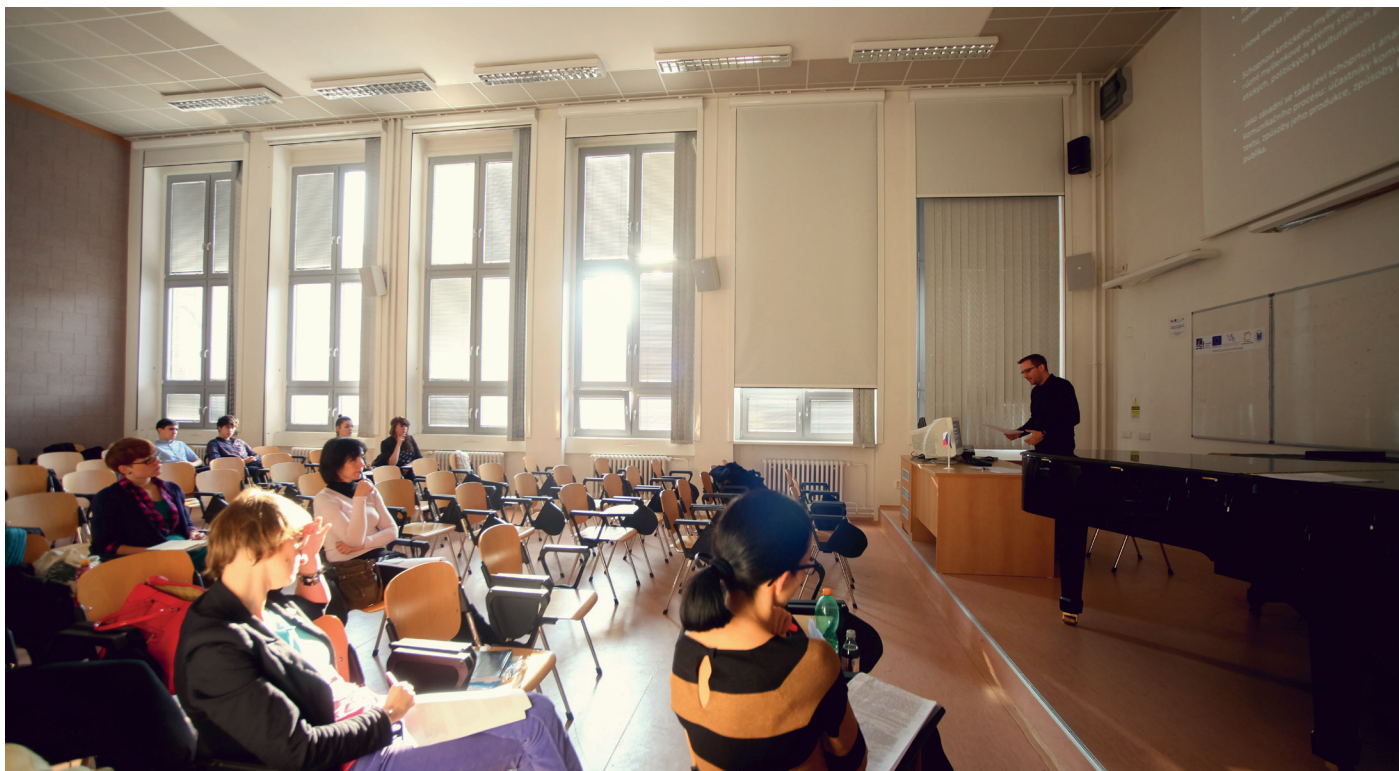
„Místo činu“: Multimediální učebna N 21 Ústavu hudební vědy, v záři listopadového slunce...