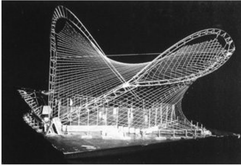
Le Diatope (1978) devant le Centre Georges Pompidou