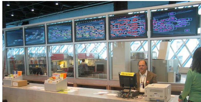
George Legrady's visualization of the flow of books in the Seattle Public Library

Analýza a vizualizace velkých datových souborů, především aktuální kulturní produkce na internetu.