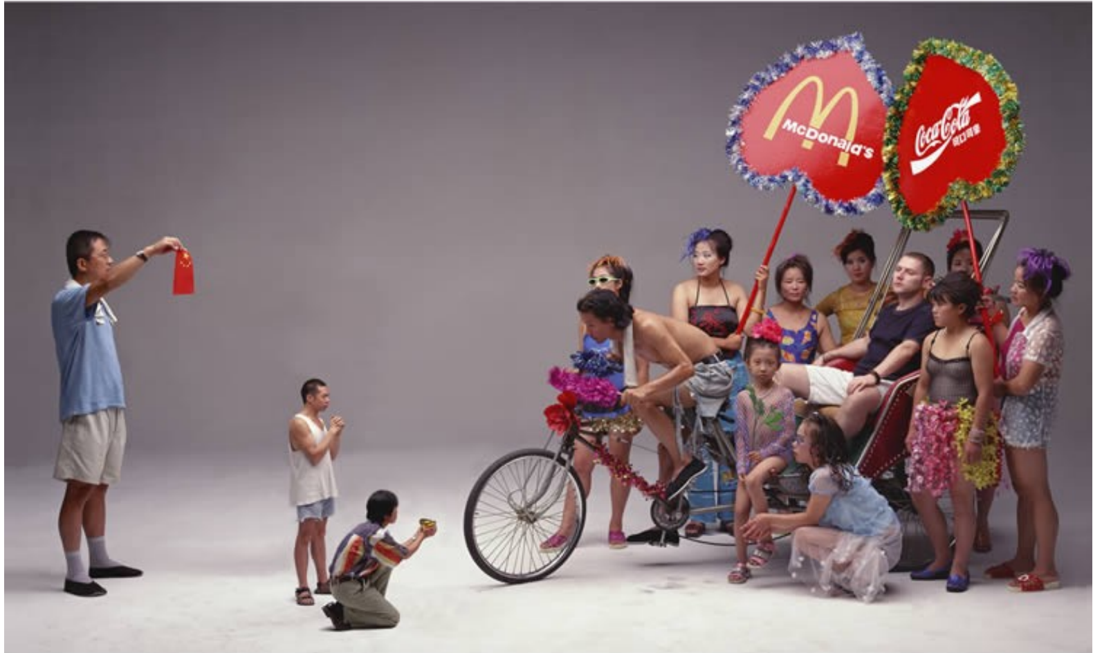
„Can I Cooperate with You?“, Wang Qingsong, 2000