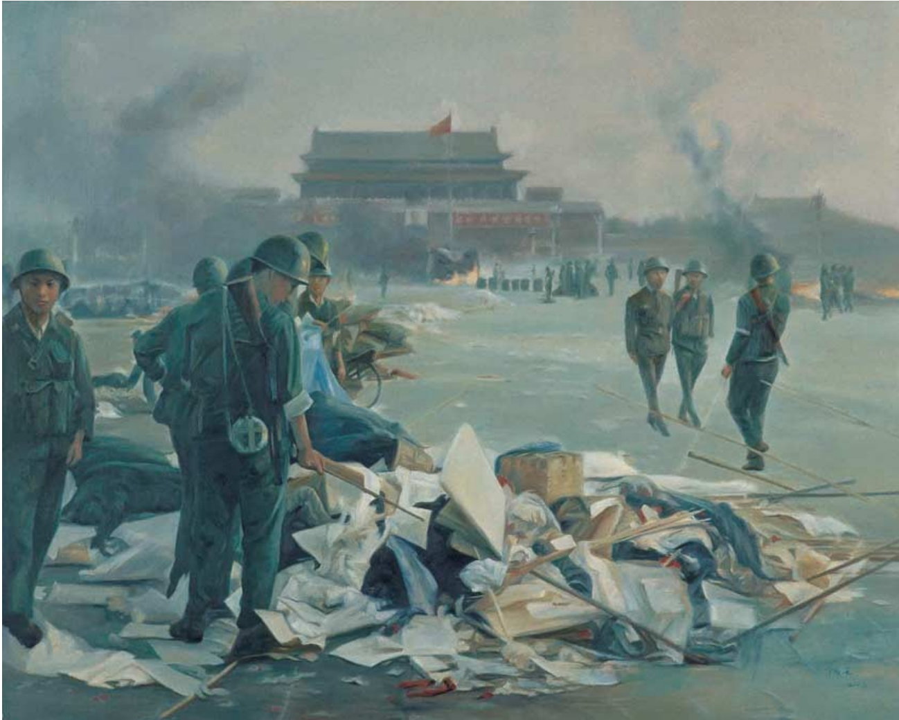
„Impulsion to Extremeness“, Chen Guang, 2008