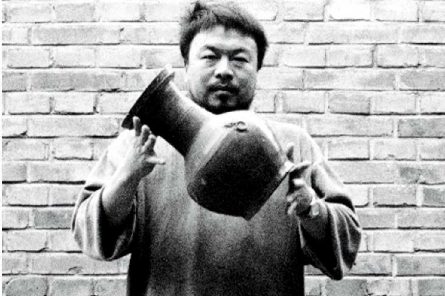
Ai Weiwei, 1995, „Upuštění vázy z dynastie Han na zem“