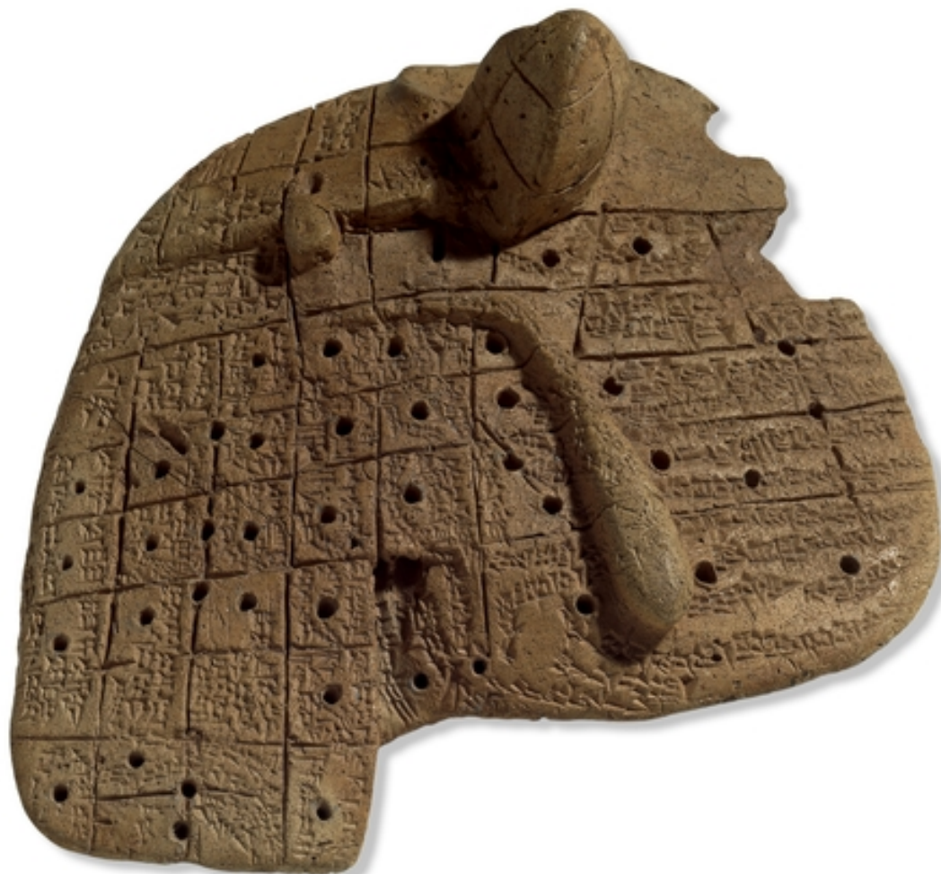
Ovčí játra, Starobabylonské obd., Sippar, British museum