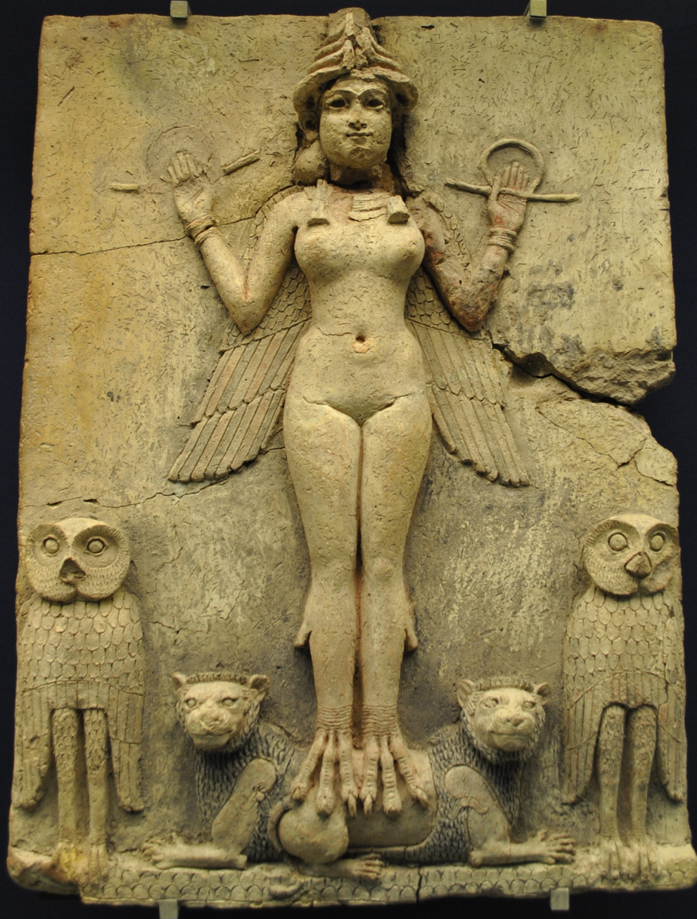
Pravděpodobně Ereškigal či Ištar; Starobabylonské obd.