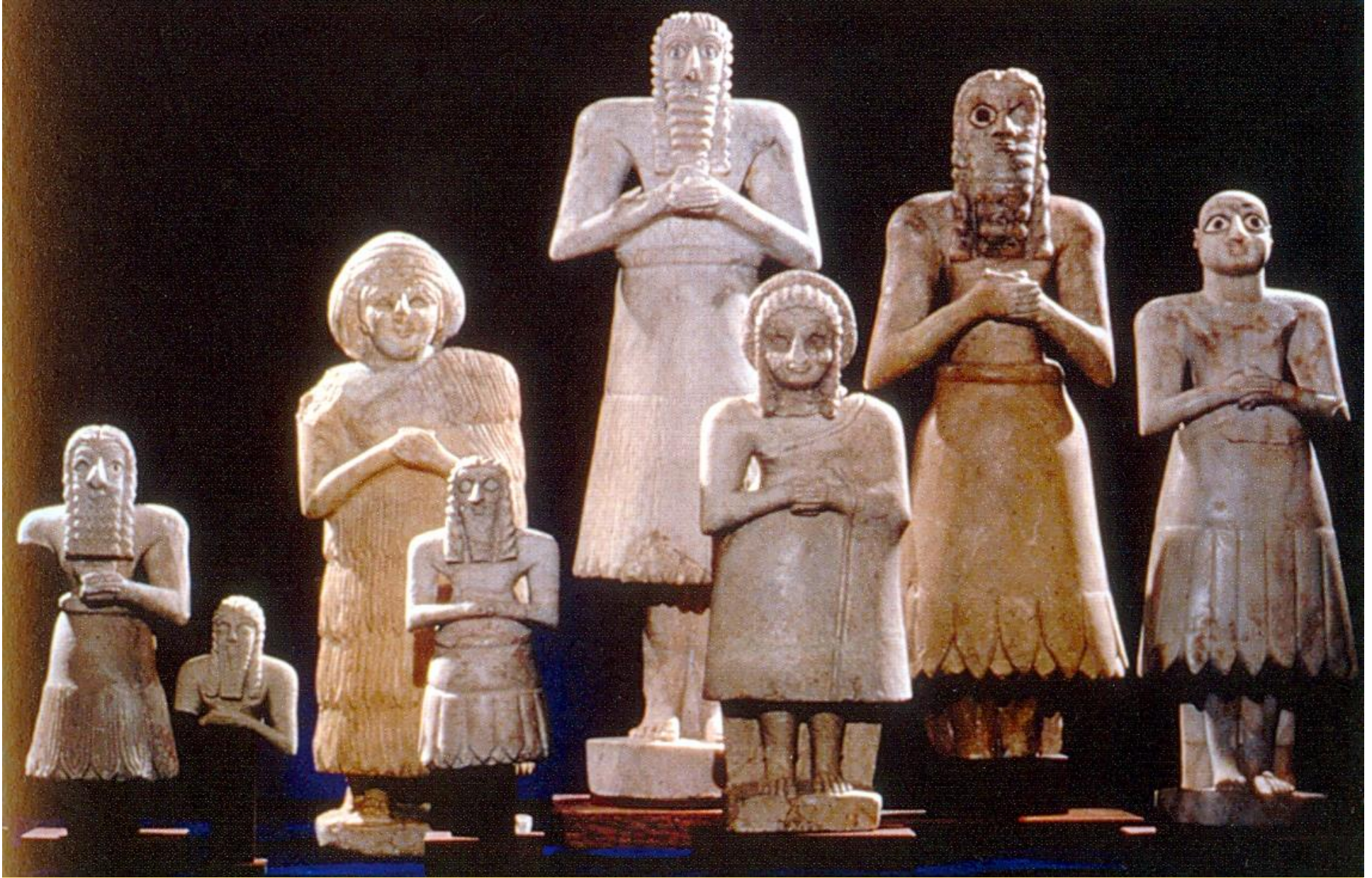
Sumerští věřící, uctívači (ED Period)