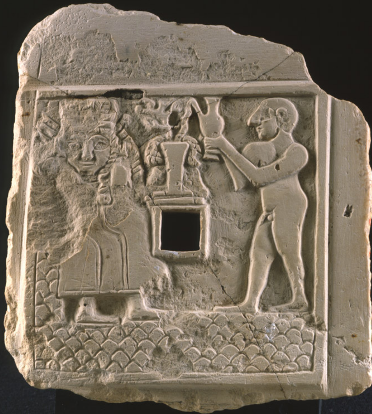
Raně dynastické období – úlitba bohům