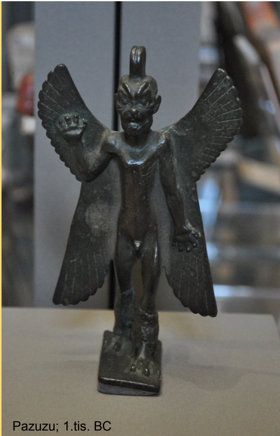
Pazuzu; 1.tis. BC