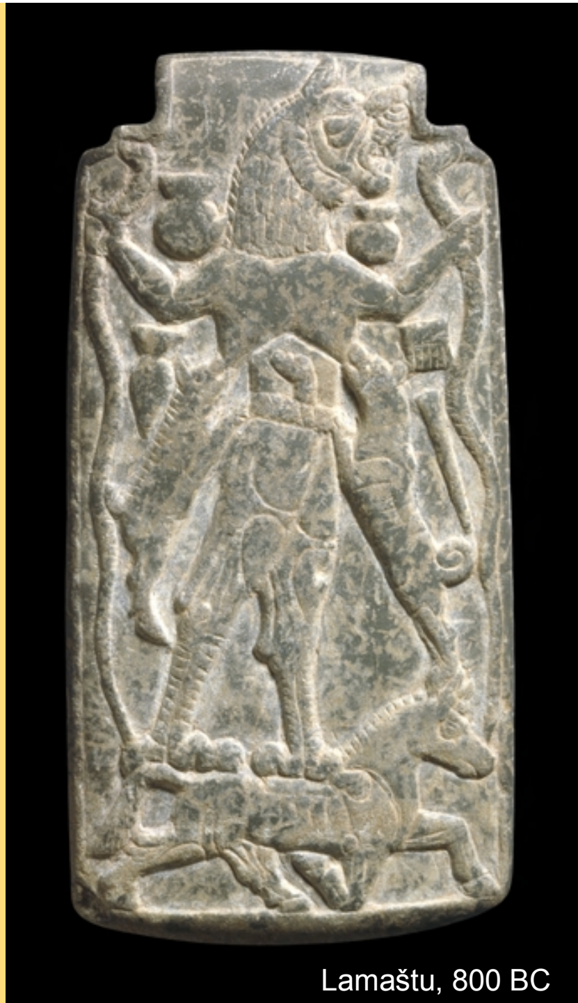
Lamaštu, 800 BC