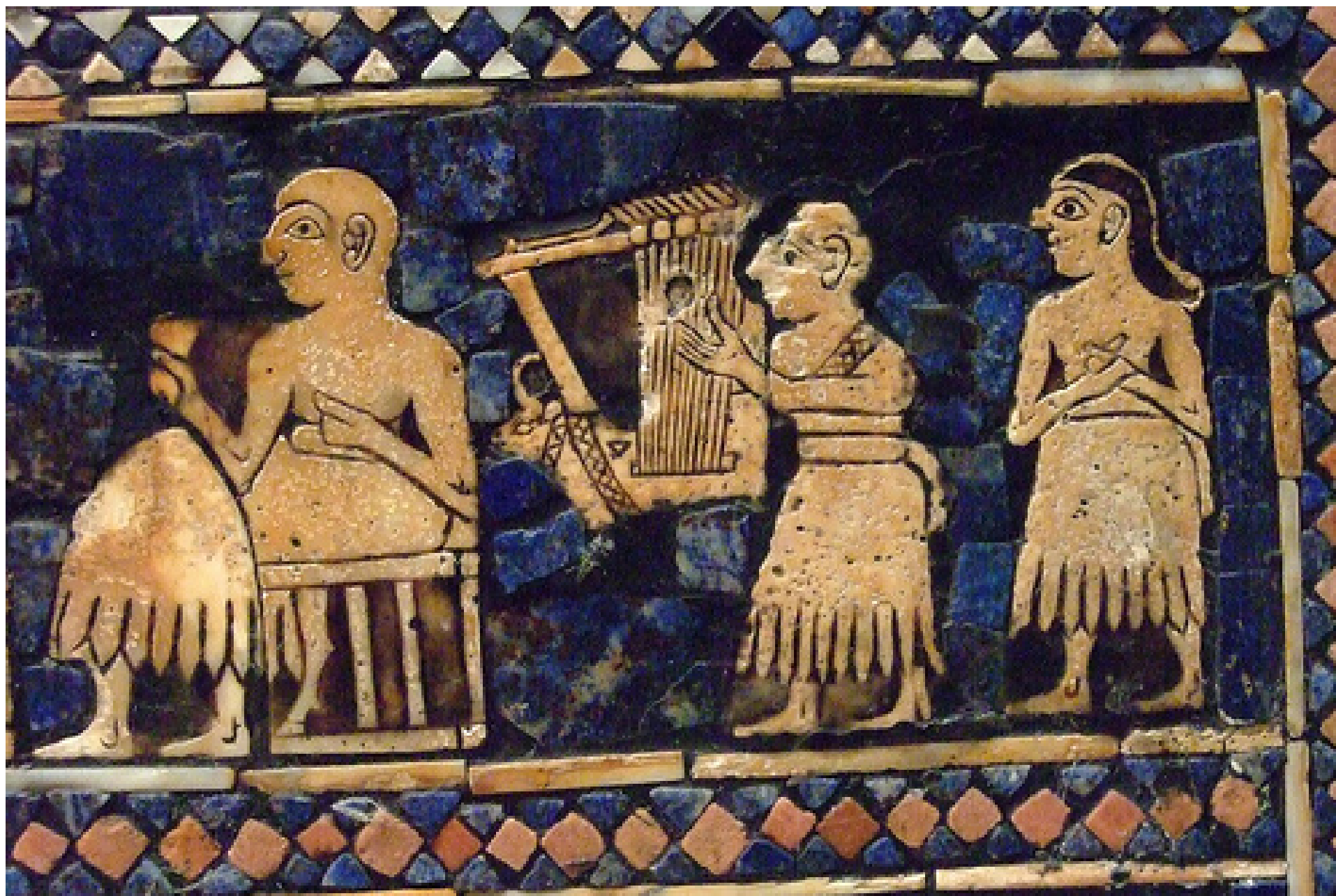
Královská standarta z Uru, Královský hřbitov, 2600-2400 BC