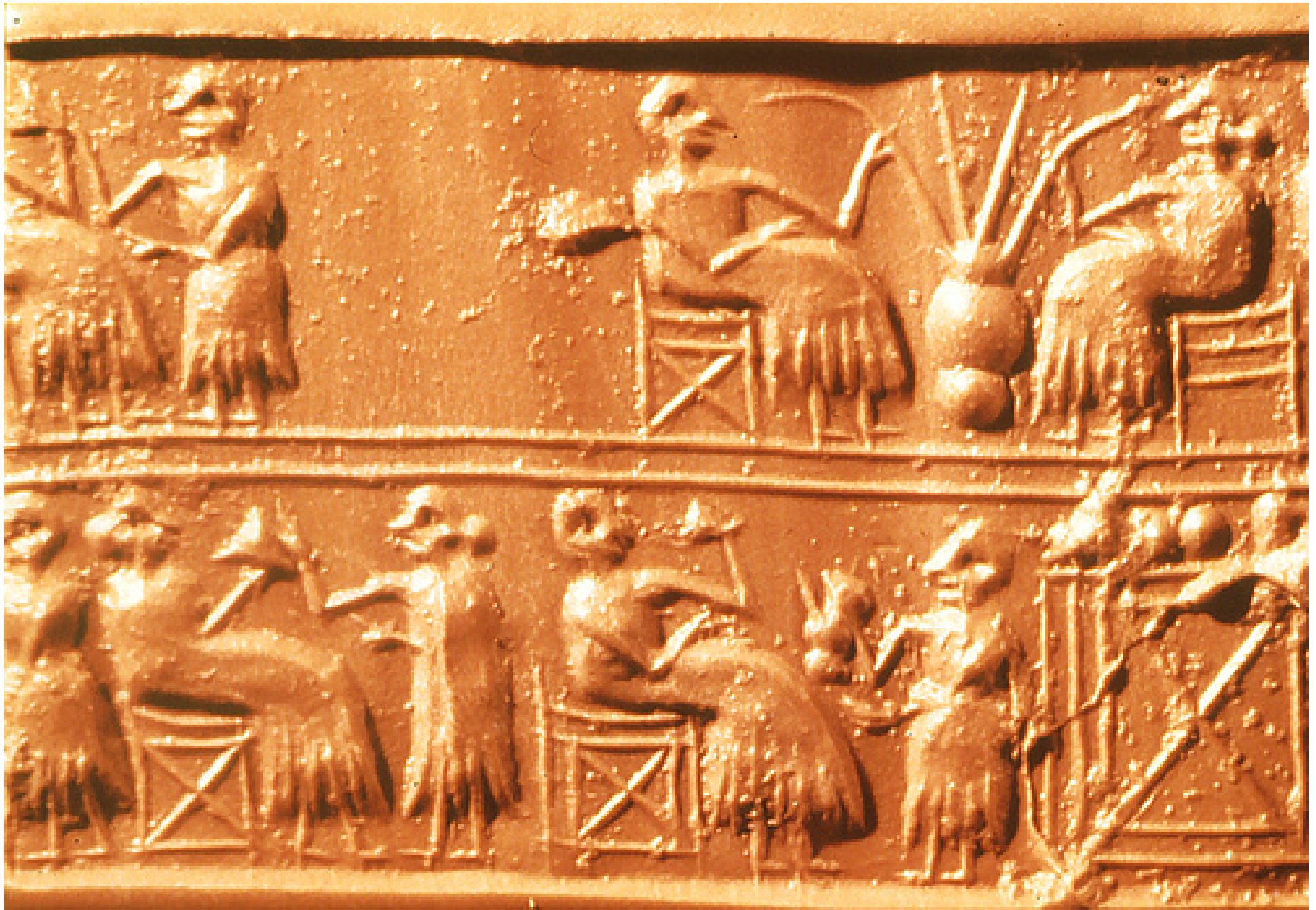
Sumerian banquet (BM 121545)