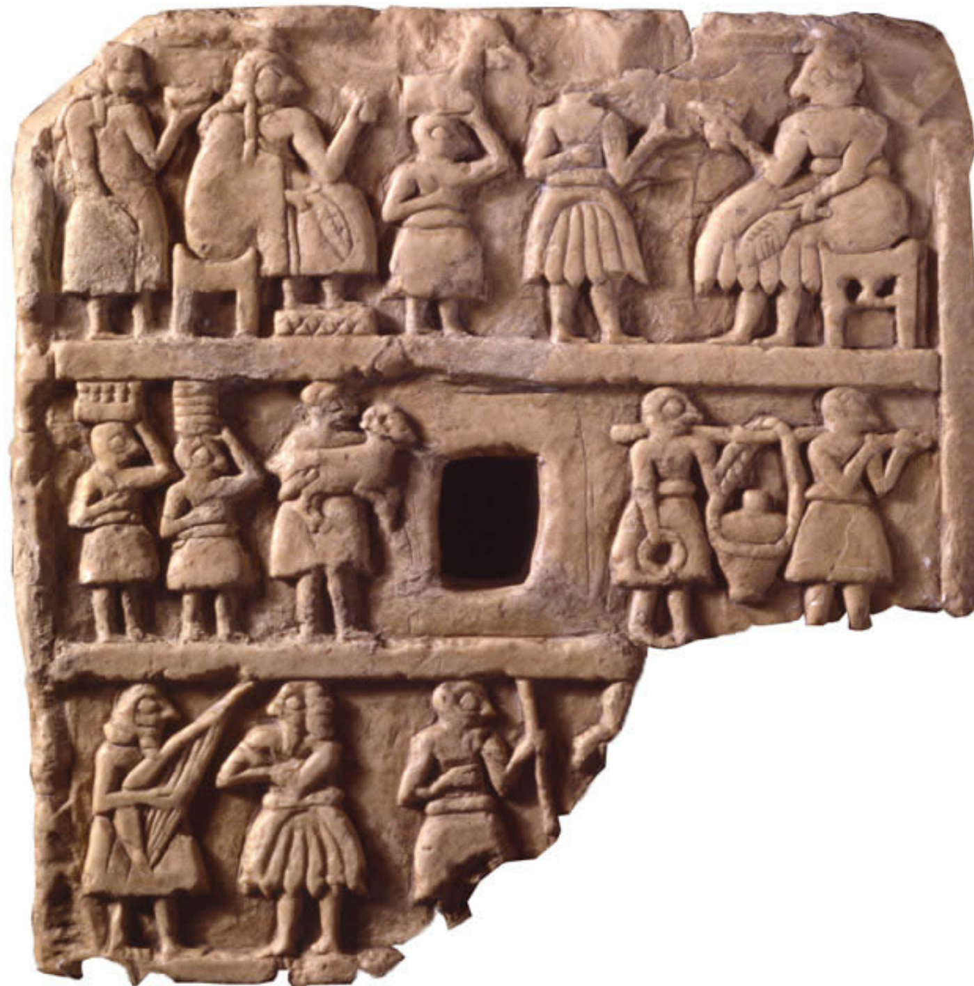
Hostina, Khafajah, chrám boha Sína, počátek 3. tis. BC