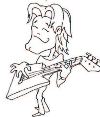
grać na gitarze