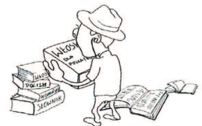
uczyć się języków obcych