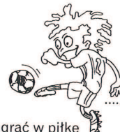
grać w piłkę