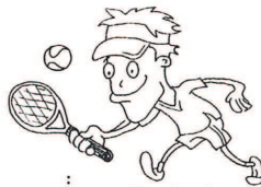
grać w tenisa