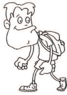
chodzić na spacer (na siłownię, do kina, do restauracji)