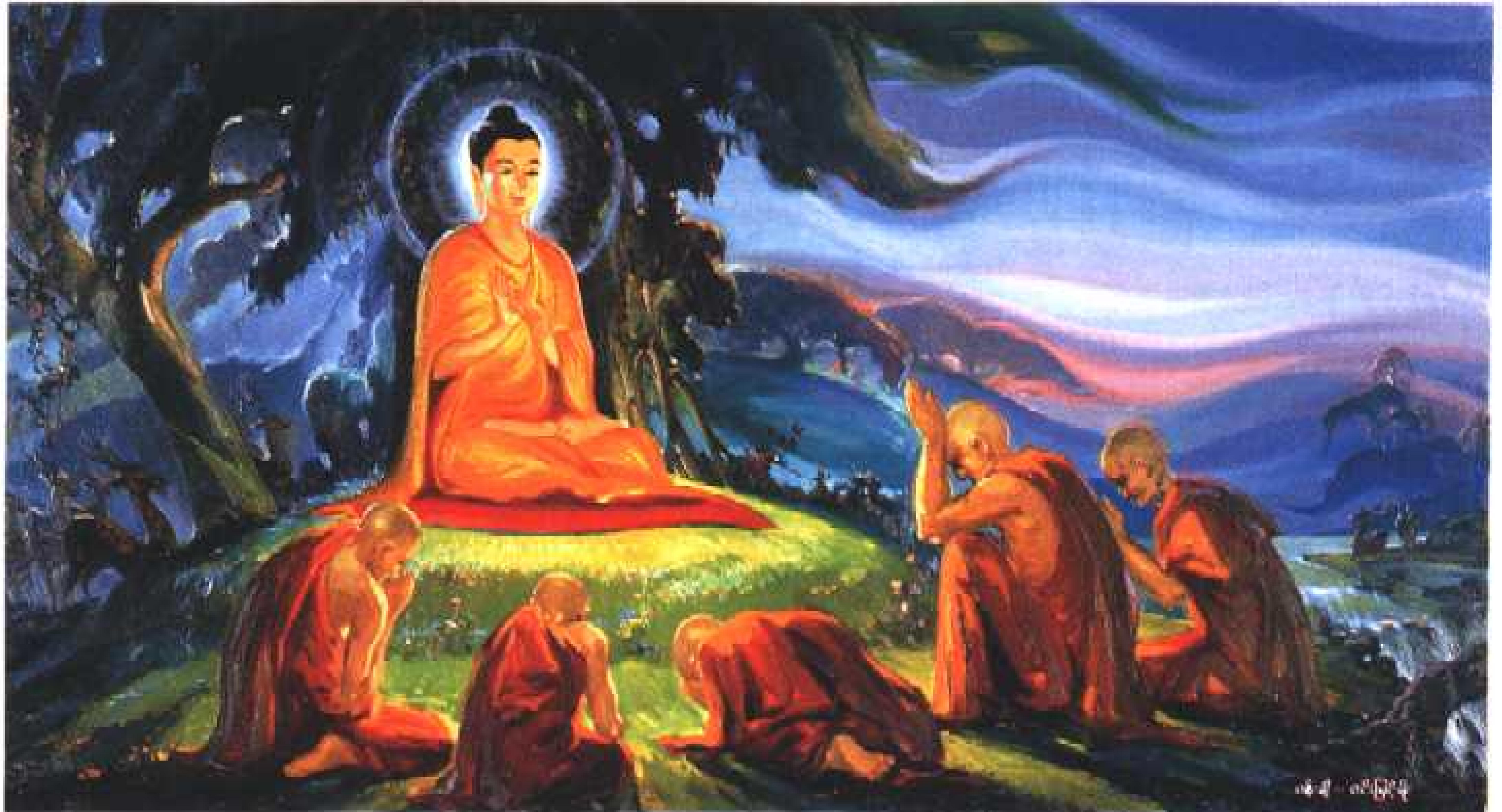
The Buddha preached His first sermon to the five monks at the Deer Park in Varanasi.