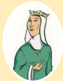
Margarita de Navarra

En 1530 el rey de España abandona definitivamente la Navarra de Ultrapuertos. Enrique II casa con Margarita, hermana de Francisco I de Valois, rey de Francia. La corte de Enrique y de Margarita de Navarra se convierte en brillante foco de cultura, que protege a los más destacados intelectuales europeos, de la persecución por motivos religiosos. Navarre shall be the wonder of the world ("Navarra será la admiración del mundo") escribió Shakespeare refiriéndose a la Navarra de esta época.