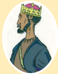
Carlos III, el Noble

Supone la recuperación de la legitimidad del Reino. Casada con Gastón de Foix, al parecer también fue envenenada.