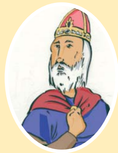
Sancho III Garcés, el Mayor

En tiempos de El Batallador, Castilla es expulsada del territorio occidental hasta Montes de Oca.