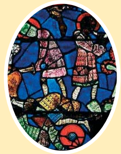
Batalla de ORREAGA

778 n.e. Los francos, en sus documentos, comienzan a llamar navarros a los vascones independientes. Carlomagno ataca y destruye las murallas de Iruñea. Pero es derrotado en Orreaga (Roncesvalles).