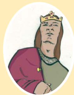
Sancho VII, el Fuerte

Alfonso VIII reconoce, en principio, la organización jurídica navarra de los territorios en que se impone.