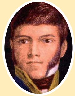
Mina el Joven

1811-12. Las Cortes de Cádiz enaltecen los fueros navarros como inspiradores de su constitución. Sin embargo los suprimen unilateralmente. Los Mina liberan el territorio y se restaura la administración navarra. Espoz y Mina entrega ambos a las fuerzas españolas.