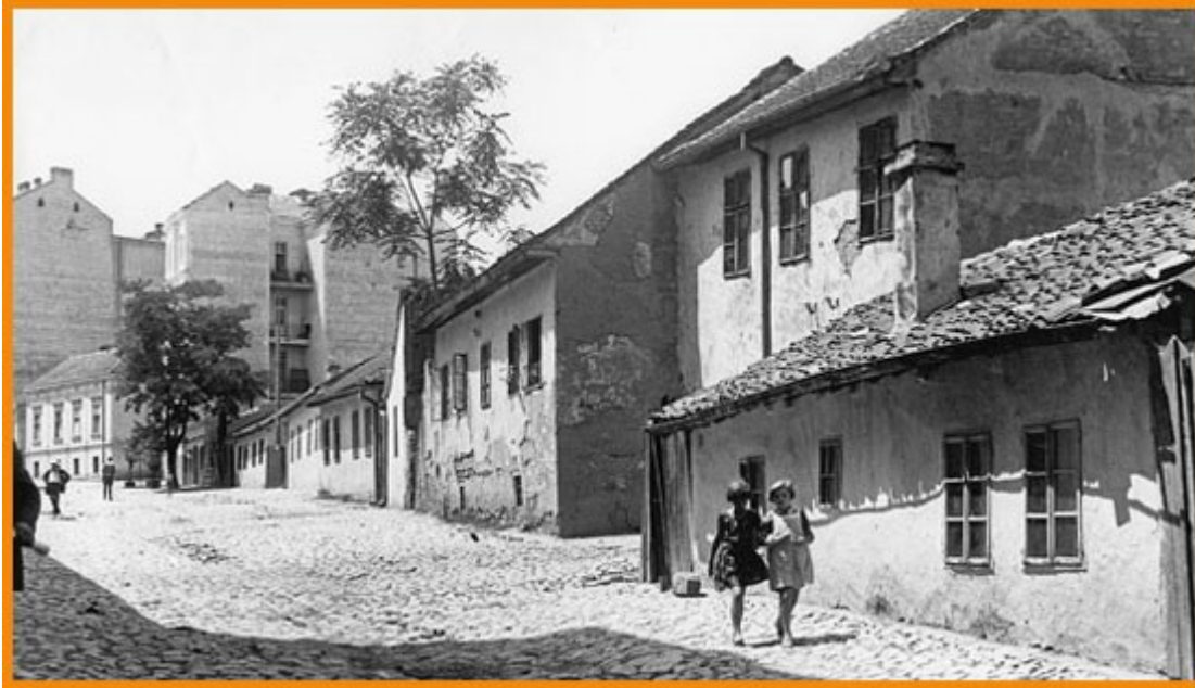
Непарна страна Скадарске улице, од Страхинића бана ка Господар-Јовановој улици, око 1930

на ово место бацају проклетство. С друге стране, за бројне невоље скадарлијских јунака, тумачења могу да се нађу пажљивим читањем историје и ондашњих прилика с којима су у сукоб долазили својеглави или поносни карактери попут Јакшићевог.