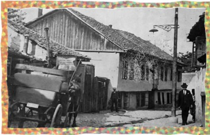
Средином турске калдрме у горњем делу Скадарске улице налазио се канал којим се за време киша одливала вода. С обзиром на то да није било канализације, туда је текла и прљава вода после прања рубља и посуђа.

„Нисам боeм. (Јесам ли био?) Боeм може бити само слаб пјесник, слаб сликар, слаб умјетник; боeмима се сматрају само такви који не могу завршити, а често ни почети дјело.”