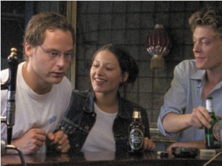
Mongoland, r. Arild Østin Ommundsen, 2001