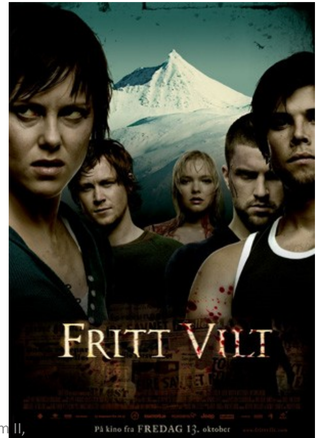
Ledová smrt (Fritt Vilt, 2006, r. Roar Uthaug)