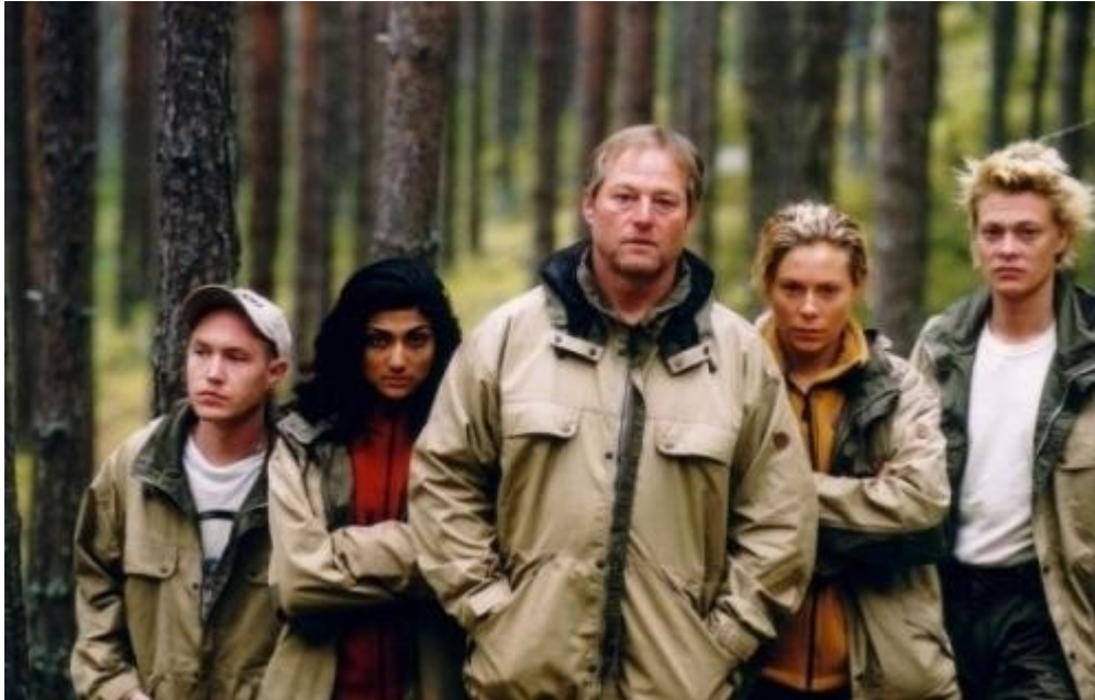
Temné lesy (Villmark, 2003, r. Paal Øie )