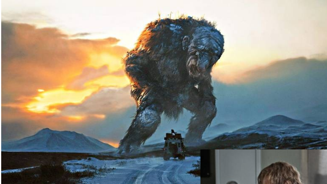
Lovec trolů, 2010, r. André Øvredal