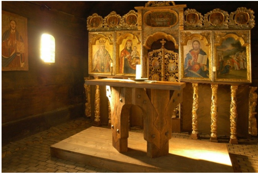
Carská vrata v kostele Všetech Svatých v Dobříkově