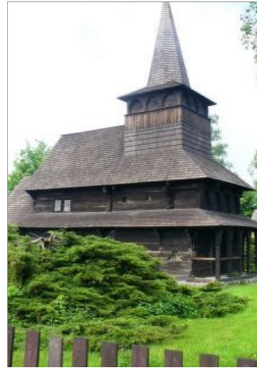
kostel Všech Svatých v Dobříkově

Obě sakrální stavby představují sloh gotický, označovaný také jako marmaroško – sedmihradský. Jsou typickými představiteli gotizující formy horního Potisí. Vznik těchto kostelů je datován přibližně první polovinou 17. století. Jakou intenzitu měla umělecká funkce v době jejich vzniku?