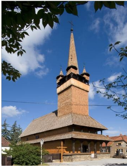
kostel svaté Paraskevvy v Blansku

Během 20. a 30. let dvacátého století bylo do Čech a na Moravu přemístěno pět dřevěných kostelů z Podkarpatské Rusi a jeden z východního Slovenska. Chci se zabývat otázkou funkce umění ve dvou z této šestice kostelů; totiž - v kostele svaté Paraskevvy v Blansku a v kostele Všech Svatých v Dobříkově.