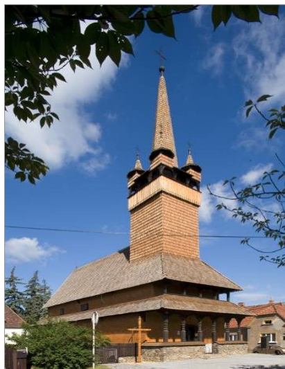
kostel svaté Paraskevvy v Blansku

Během 20. a 30. let dvacátého století bylo do Čech a na Moravu přemístěno pět dřevěných kostelů z Podkarpatské Rusi a jeden z východního Slovenska. Chci se zabývat otázkou funkce umění ve dvou z této šestice kostelů; totiž - v kostele svaté Paraskevvy v Blansku a v kostele Všech Svatých v Dobříkově.