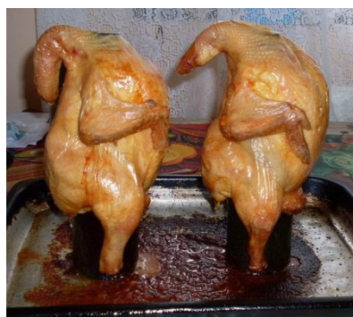
sült csirke (pečené kuře)