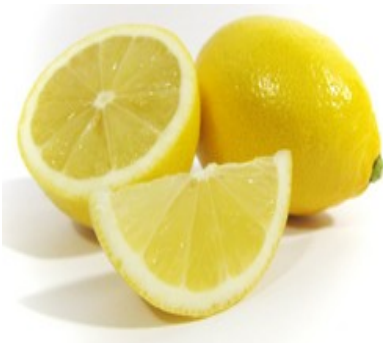
Ez egy citrom - citromsárga (szín)

A „kék” (színű) szőlő a ...fehér... és a ....piros... (színű) ... között... van.