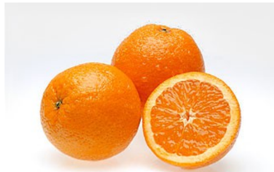
Ez egy narancs. -