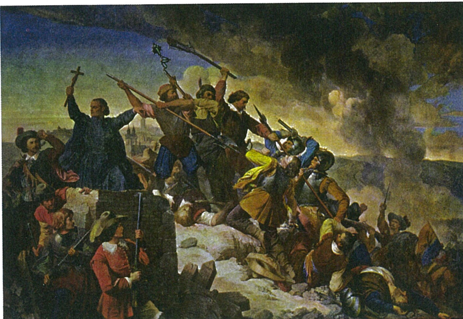
Ve jménu „Lva ze severu“. (Švédové se snaží dobýt Prahu, 1648)

Trýznila ho naopak otázka, jestli ve světě všeobecného rozvratu a zhroutených tra-