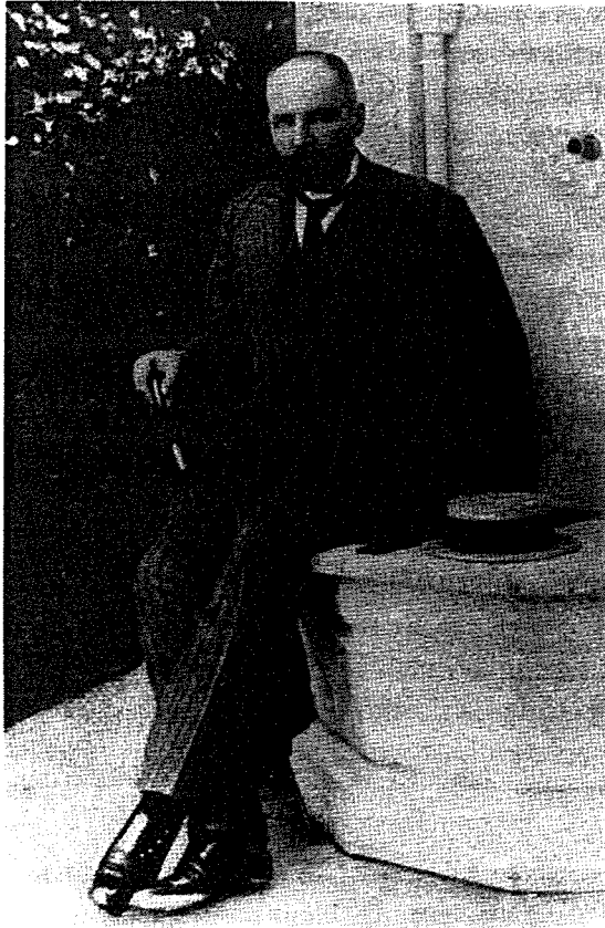
Pjotr Stolypin, 1909.

diplomatickým schopnostem vyšli Rusové z těchto jednání vcelku slušně.