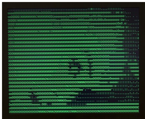
Vuk Cosic: ASCII history of moving images (Psycho), 1999