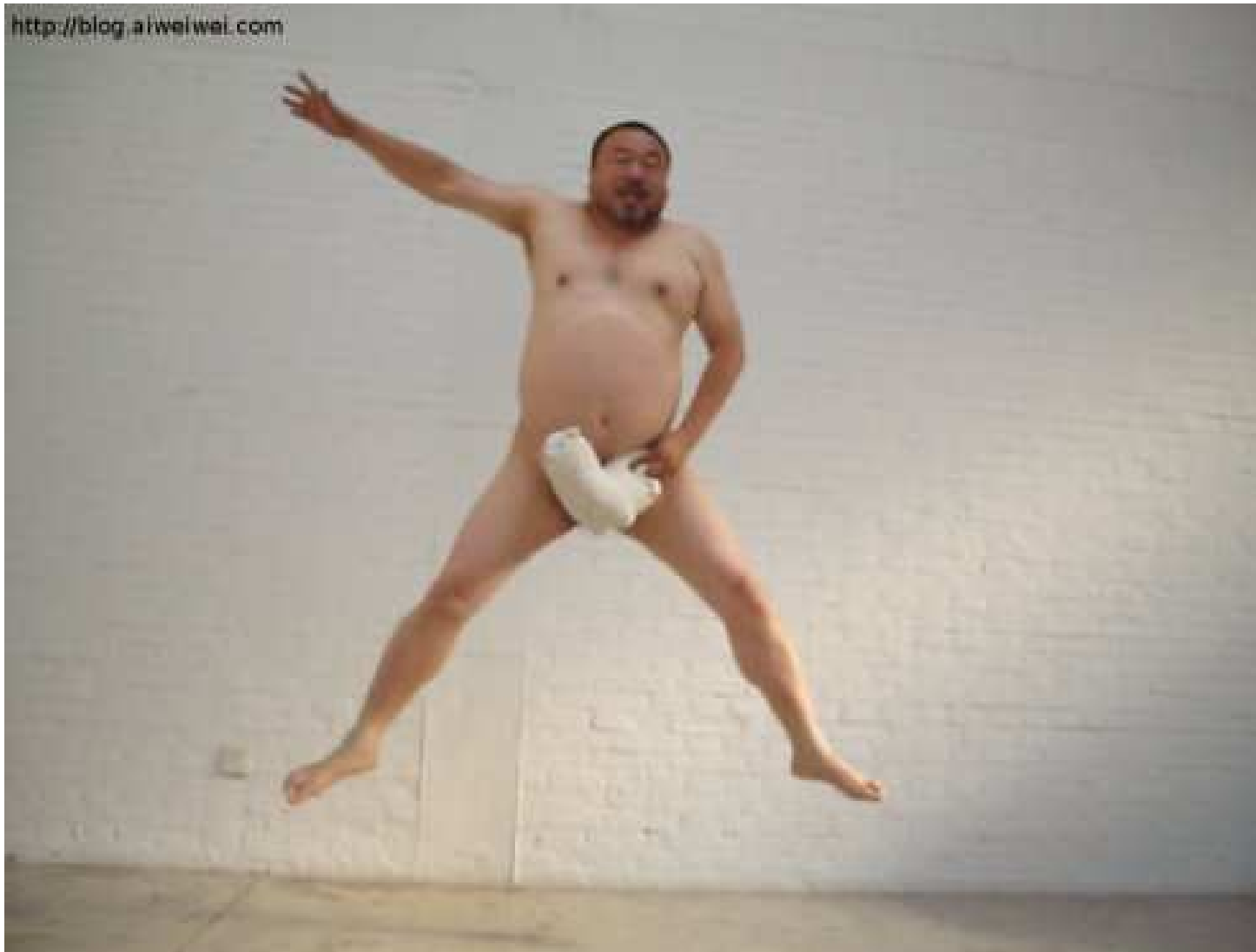
Ai Weiwei, 2009, Lama zakrývající rozkrok (草泥马挡中央)