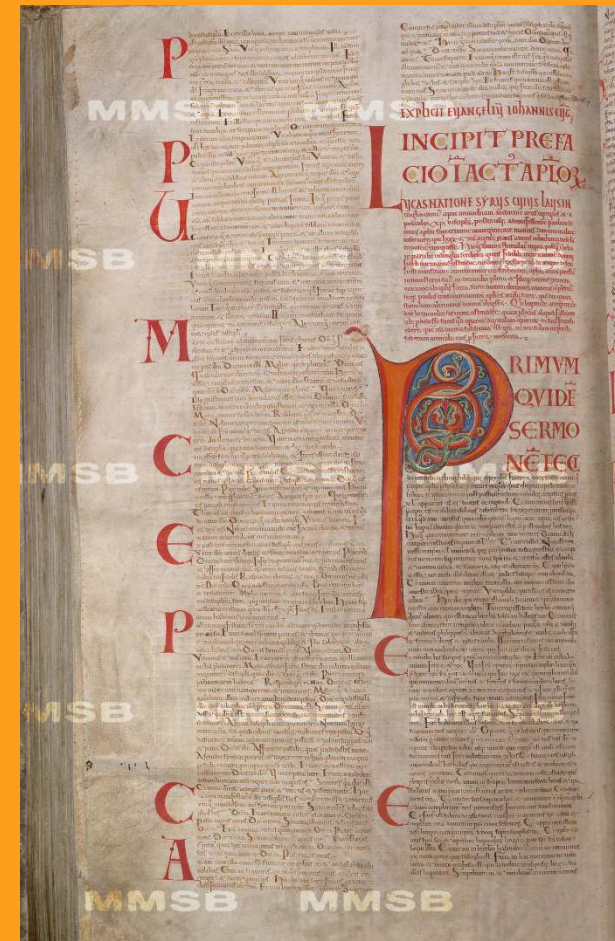
tzv. Codex gigas

Stuttgartské vydání (1969) – Biblia sacra iuxta vulgatum versionem