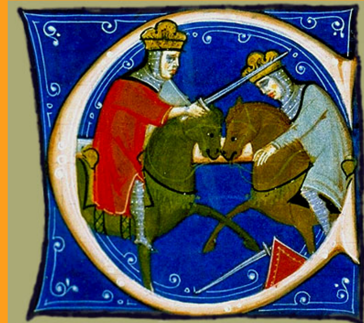
Alexander a Darius