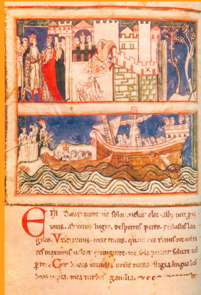
Aeneas a Dido