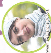
Nazywam się Blanche Dubois.

a) Jestem z Polski. Jestem Polakiem. Mówię po polsku i po angielsku. Znam też trochę język rosyjski. To jest Władimir. On jest Rosjaninem. Mówi po rosyjsku i po polsku.