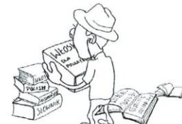
ucyt sie jzykow obcych