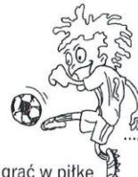
grac w pilke