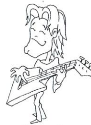
grac na gitarze