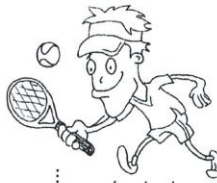
grac w tenisa