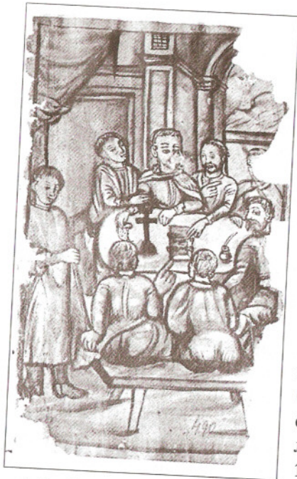
2. Засідання міської ради Белза. Аматорський малюнок у львівській градській книзі (1703 рік) (ЦДІА України у Львові, ф. 22, оп. 1, стр. 7, арк. 490); Мирон Капраль. Національні громади Львова XVI–XVIII століть (соціально-правові взаємини) , Львів: Піраміда, 2003)

друге, навіть цей артикул про відьом з'явився щойно в Третньому Литовському Статуті (1588), яким суди Гетьманату взагалі не мали керуватися.