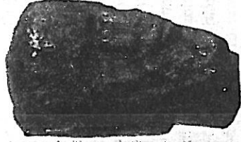
294. Głowa posq-gu drewnianego z Jankowa, pow. mogileński

Znany je z Behren-Lübchin w dawnej ziemi Obodryców, z Alt-Friesack w pow. रुपińskim na terenie Luciców, w dzisiejszej Brandenburgii, a samą głowę podobnego bóstwa, osadzoną ongiś na oddzielnie wykonanym tulo-wiu lub prostym słupie, znaleziono w jeziorze jamkowskim koło Pakości, w pow. mogileńskim w Wielkopolsce (rys. 294) 74 . Jest to głowa męska z wąsem i przystrzyżoną brodą, wyrzeźbiona z dębiny. Na Śląsku ósrod-ktem kultu pogańskiego była góra Słęża (Sobótka), w Wielkopolsce zape-wne Gniezno. Poza tym śladami istnienia innych podob-nych miejscowości mogą być nazwy miejscowe, jak Mo-dła, Modlica itp., wyraz modla bowiem — według Brücknera — oznaczał dawniej ofiarę całopalną, swią-tynię pogańską, a nawet bałwana 75 . W gajach stały zapewne jakieś ołtarze, może w postaci wielkich głazów z naturalnymi wydrążeniami (mischkami), które tu i ówdzie do niedawna były przedmiotem czci. Takim ołtarzem był może duży głaz narzutowy pod wsią Koł-bielą nad Swidrem w Siedleckiem, w którego eliptycz-nych zagłębieniach lud okoliczny w pierwsze święto Wielkanocy składał reszki święconego i pieniądze, oraz czczony również kamień w Kaliskiem, z wklęsło-ścią zwaną wanienką Matki Boskiej, odwiedzany w święto Narodzenia Matki Boskiej 76 .