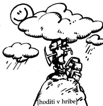
[hoditi v hribe]