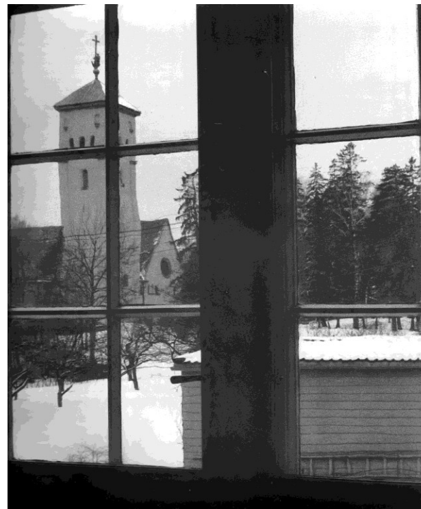
Zimní večer , fotografie ke stejnojmenné básni Georga Trakla, z expozice knihy Genius loci . Inspirováno Heideggerem – poesie přispívá k výkladu architektury.