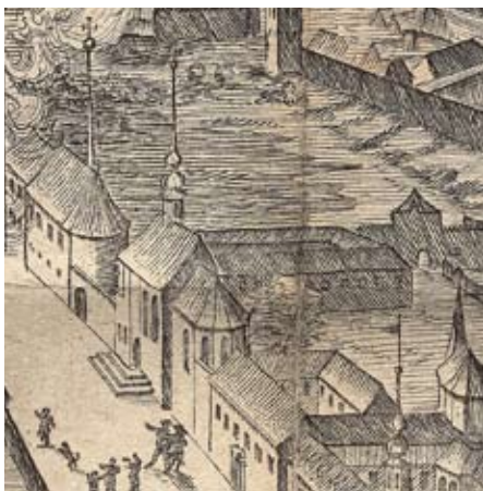
### Univerzitní teze Mathiase Schmidta, 1676, mědiryt, detail kláštera klarisek se středověkým konventním kostelem. Zemský archiv v Opavě, pobočka Olomouc.

klarisek na předhradí proti jezuitskému klášteru. Je třeba připomenout, že jeho uměleckohistorický význam byl vždy oceňován, nicméně především nedostatek relevantních dokumentů a několikrát proměna funkce původních klášterních budov byly pravděpodobně oním důvodem, že dosavadní vědomosti o jeho dějinách jsou dodnes založeny pouze na důkladných archivních rešerších Václava Buriana z padesátých let 20. století. 2 Ty přitom poskytují přece jen poměrně málo prostoru pro uměleckohistorickou interpretaci tohoto pozoruhodného architektonického komplexu.