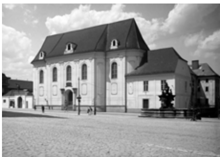
### Klášter klarisek s kostelem sv. Kláry od jihovýchodu, fotografie z první poloviny 20. století. Vlastivědné muzeum v Olomouci.

Základem členění vnějších fasád byly široké lizénové rámy, do nichž byla zasazena okna prvního a nejvyššího patra. Na dělicí lizénu byl poté nasazen pilastr, ovšem bez řádového rozčlenění. V zásadě se tedy jedná opět o lizénu, která obsahuje patku na spodní straně a krycí desku se zavěšenými půlkruhovými terčí. Právě takové zdůrazňování lizénového členění fasády nalezneme prakticky na všech stavbách, které bývají se zednickým mistrem Matyášem Kniebandlem spojovány. Patrně jeho první významnější realizací (ještě za života jeho otce) byla výstavba kaple sv. Anny při farním kostele v Mohelnici (1726–1727) pro faráře a olomouckého kanovníka Leopolda Bedřicha z Egkhu. 11 Kaple na jednoduchém podélném půdorysu má fasádu jednoduše členěnou lizénami. Obdobné řešení nalezneme také na dalších částech farního kostela: u později postavené kaple Těla Kristova a vstupní předsíně (před rokem 1734). Od té doby můžeme s Kniebandlem spojit ještě další olomoucké stavby, jež se vyznačují shodným, plošně lizénovým členěním fasád.