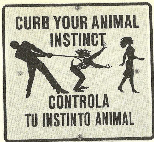
Ilona Granet, Curb Your Animal Instinct (Zklidni hormony), 1986

net vytvořila symboly mužských autorit. Její Bums/Bomb (Anální bomba) znázorňuje čtyři monolitické postavy poskládané ze znaků, jež v naší kultuře znamenají úspěch a vliv mužů. Granet vysvětluje, že tyto komiksové obrázky superhrdinů – velkostatkáře, průmyslníka, mediálního magnáta a vojevůdce – jsou přesně tím, co „bych vlastně měla propagovat“. (Jedním z jejích předchozích klientů byl právě tiskový magnát Malcolm Forbes, jemuž malovala jméno na jachtu.) Obrazy korporáčních válečníků vrcholného kapitalismu umístila do čtyř obrovských raket ve tvaru sarkofágu, jako by to byly tajné zbraně v „totální válce“ dozoru a kontroly, a zavěsila je nad vchodem do galerie. Jak si všimla Jeanne Silverthorne, podlouhlý vertikální tvar těchto komiksů připomíná prapory z místností, v nichž se shromažďovali stoupenci Třetí říše. Na výstavě, kde kralovala karnevalová zábava, však tyto výjevy ztratily svou svrchovanou moc: proměnily se v „komická strašidla“, která je třeba vymáchat ve vodě, v melancholické klauny ze soutěží v házení dortů.