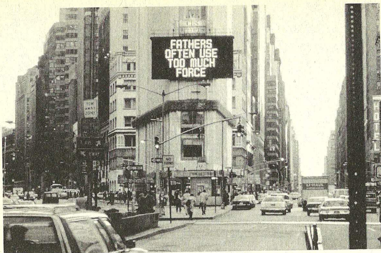
Jenny Holzer, Truisms (Truismy) , 1977-79

a agrese muži, a proto není výjimkou, když je za autora těchto textů považován muž. Holzer přiznává, že hlas maskulinity svým způsobem „ukradla“, ale její verbální cross-dressing není nikdy úplně dokonalý. V normativních jazykových konvencích veřejného informačního systému, který umělkyně používá, se totiž znaky ženskosti obvykle proderou na povrch. „Tón mých prací je velmi přesně vypočítaný – používám uhlazený jazyk odpovídající anonymnímu hlasu vyšší střední třídy,“ říká Holzer. 34