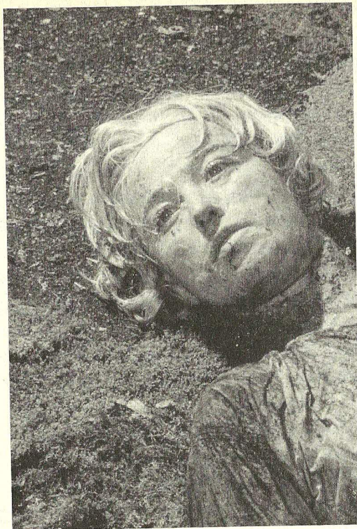
Cindy Sherman, Untitled Film Still #153 (Filmový obrázek bez názvu #153), 1985

jako Emmino tělo nakonec „matně rozplývá do předmětů kolem“. (s. 240). Nakonec je to Sherman, a ne Flaubert, kdo může říci Emma Bovary, c'est moi .